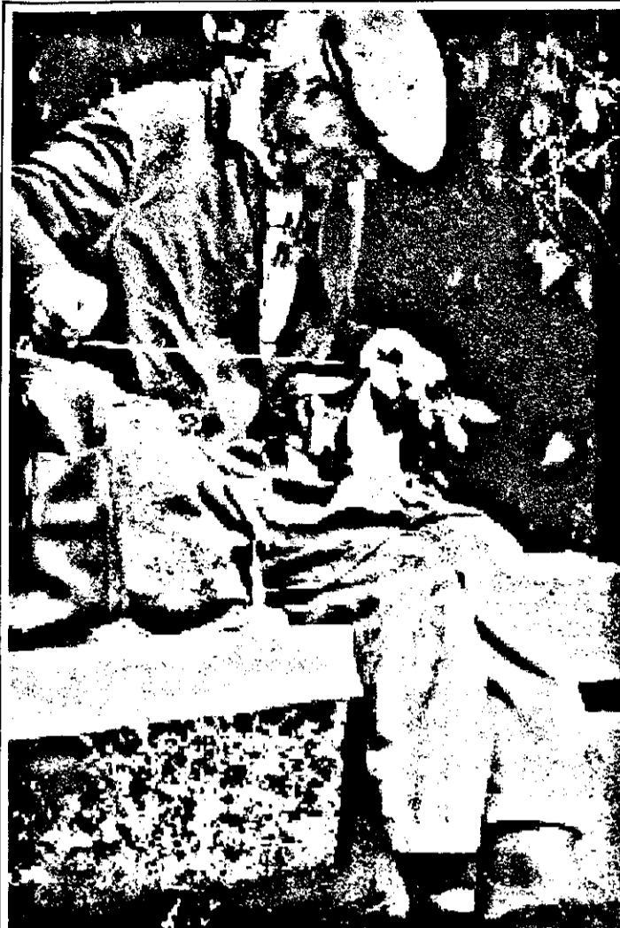
Bătrânețe, haine grele: mai coasem, mai cărpim, că de haine noi, la actualele prețuri, nici vorbă!