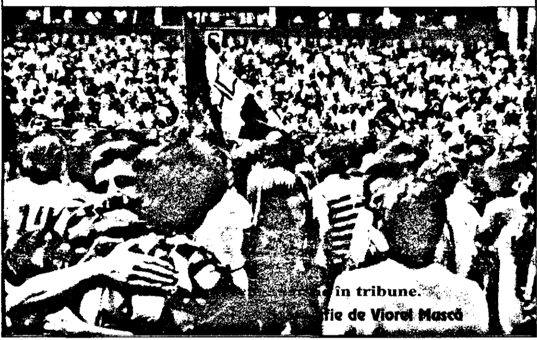
... în tribune. ... de Viorel Măscă