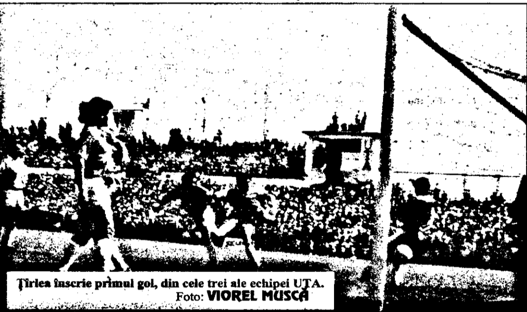
Țirlea înscrie primul gol, din cele trei ale echipei UTA.