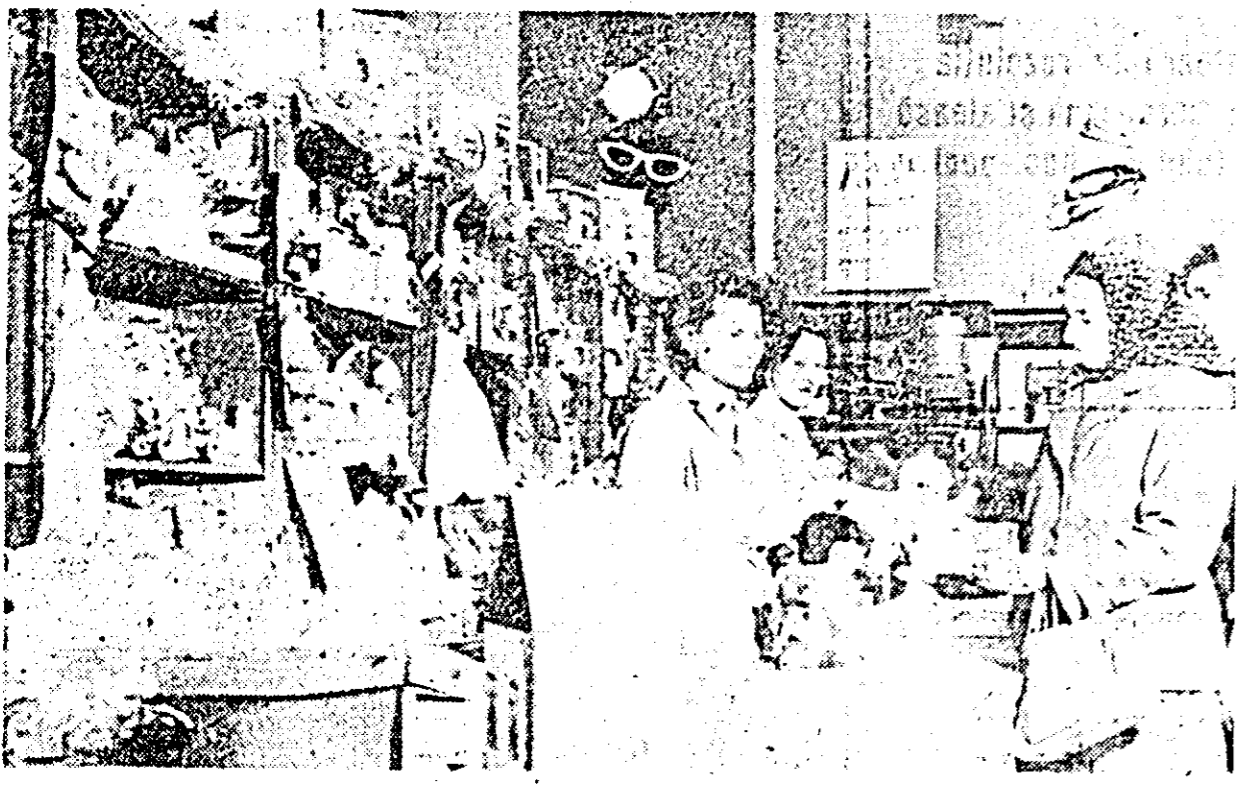
În cadrul „Lunii cadourilor” la magazinul „Universal” din orașul nostru, s-a amenajat un raion specializat pentru desfășurarea jucăriilor, care se bucură de căutare.