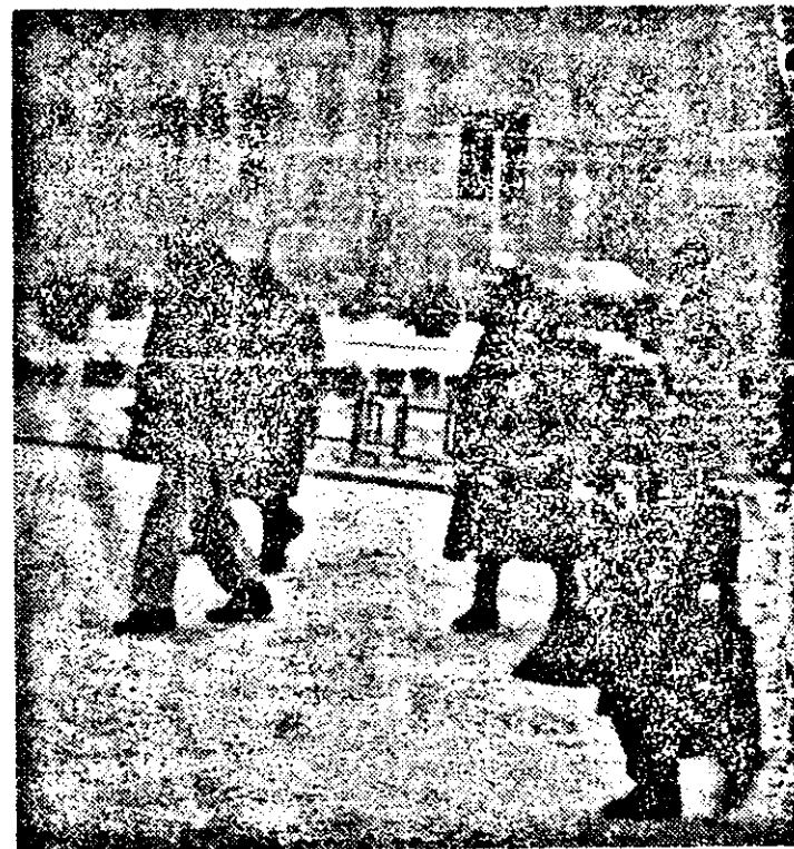
Așteptam zăpada miilor, dar a fost ceva mai mult. Oricum, parcă ne era dor de... albi!