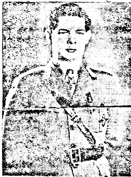
M. S. REGELE MIHAI I.

telegrame adresată mareșalului Stalin și a arătat că oamenii sovietici împărtășesc bucuria poporului român.