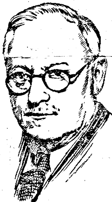
ANDREI I. VAȘINSKI