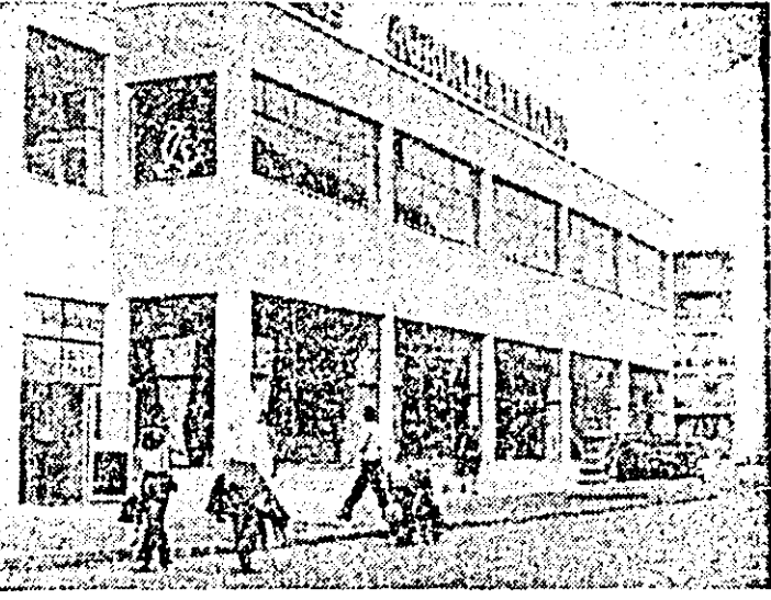
Aspect din noua piață agroalimentară din zona Vlaicu.