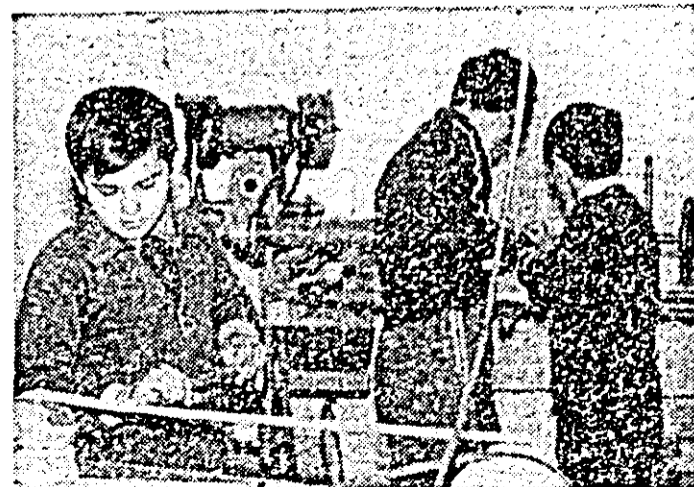
În cadrul cercului tehnico-aplicativ de împlărie al casei pionierilor și școlilor patriei din Pincota copiii deprind tainele viitoarelor profesii.

Toate aceste obiective, precum și cele pe care nu le-am putut aminti din lipsă de spațiu, ne dau imaginea unui oraș în plină dezvoltare, un oraș, care pășeste prin hărnicia locuitorilor lui — români, maghiari, germani și de alte naționalități — spre nobile împliniri ce le va aduce cîincinulul 1981—1985. În aceste zile de februarie, pincotanii, în deplină unitate, indiferent de naționalitate, sînt ferm hotărîți să împlinească alegerile de la 9 Martie, așa cum se spune și în Manifestul Frontului Democratice și Unității Socialiste: „cu succese tot mai mari în toate domeniile, întărind astfel votul nostru cu puterea faptelor — fapte de muncă, de hărnicie și inițiativă, spre gloria și măreția scumpei noastre patrii!”.