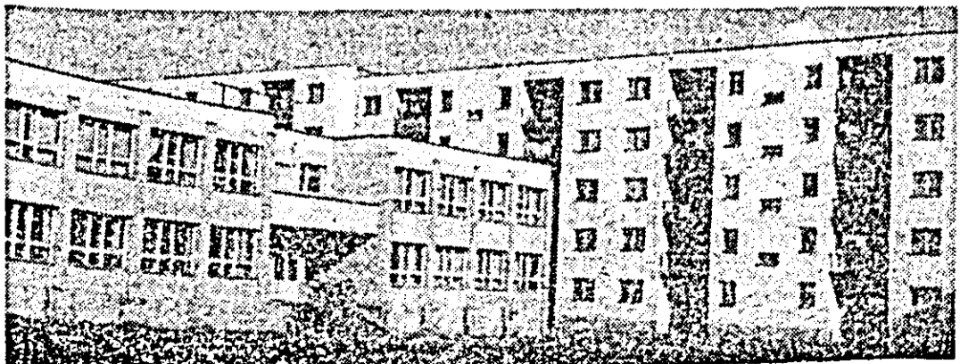
În anul actual al legislației orașul Lipova a făcut noi și importanți pași pe calea urbanizării. ÎN CLIȘEU: noi edificii de interes social-cultural.