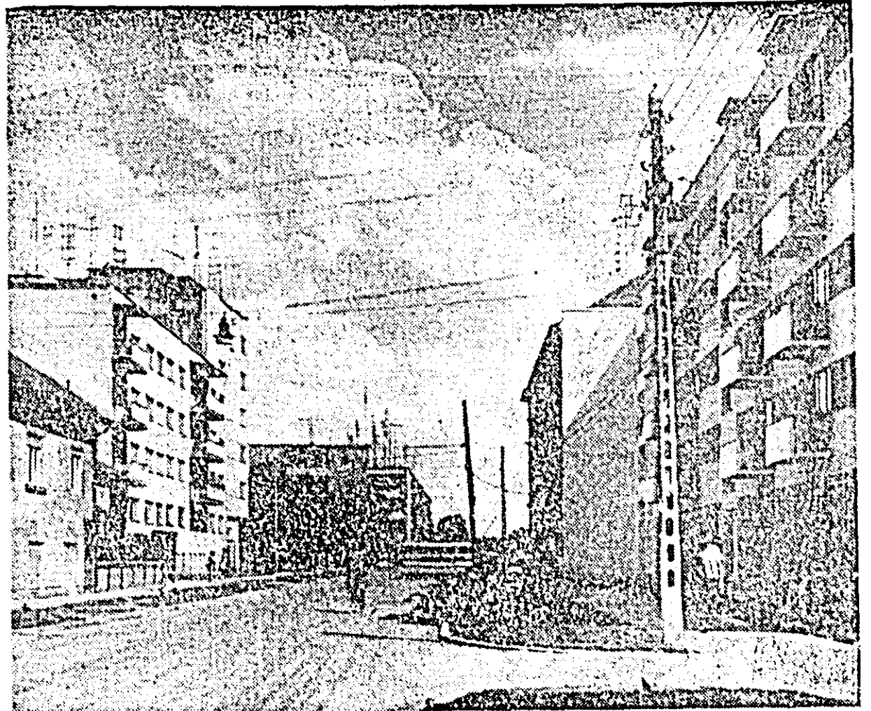
Hărnicia și fanterla constructorilor arădeni a schimbat radical înfățișarea străzii Ecaterina Varga. În locul unor clădiri vechi și dărăpănate se înalță silueta blocurilor moderne.