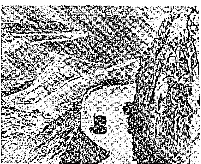
Autostrada de mare altitudine din munții Gindukus, de la trecătoarea Salang, Afganistan.

re de tensiune. Critici extrem de severe au fost formulate, în special, în statul Rio Grande do Sul, unde Vicente Sherer, arhiepiscopul de Porto Alegre, capitala statului, a condamnat hotărîrea președintelui Castelo Branco de a suspenda mandatele deputaților opoziției în scopul de a lipsi de orice șanse pe candidatul antiguvernamental la viitoarele alegeri pentru postul de guvernator.