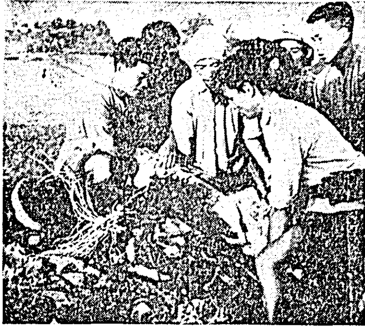
Rămășițele unui din avioanele americane, doborîte deasupra teritoriului RD Vietnam.

Intr-un comunicat al guvernului de la Saigon se anunță că premierul sud-vietnamez, Nguyen Cao Ky, se va retrage din viața politică după „alegerile” programate pentru luna septembrie a.c. Comunicatul precizează că premierul Ky nu și va prezenta candidatura în alegerile prezidențiale, ci intenționează să preia din nou comanda forțelor militare aeriene sud-vietnameze.