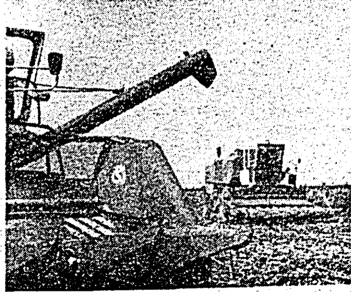
La ferma a II-a a IAS Ineu, mecanizatorii acționează la recoltatul floarea-soarelui.