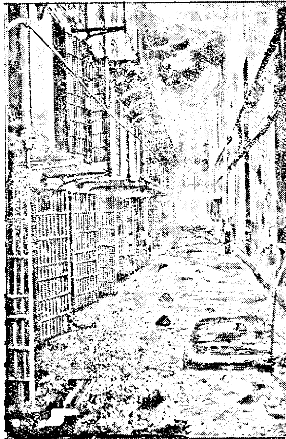
Cliseul nostru reprezintă clădirea închisorii, foarte grav avariate în cursul luptei.

După cum anunțat, în zilele trecute o mare revoltă a avut loc în închisoarea din orașul american Canon-City. Deținușii au dezarmat corpul gardienilor și s'au baricadat, ripostând cu îndârjire focurilor trase de trupele militare venite ca să-i dezarmeze. În cursul luptei, care a ținut mai multe ore, au fost ucise 20 de persoane, între cari 5 sanitari. Deținușii au capitulat numai după ce comandantul trupelor i-a amenințat că va arunca în aer întreaga clădire. Conducătorul răsculaților s'a sinucis.