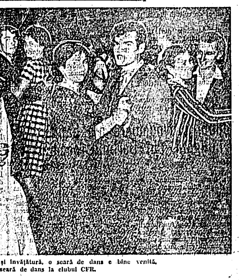
După o săptămîină de muncă și învățură, o seară de dans e bine venită. ÎN CLISEU: aspect de la o seară de dans în clubul CFR.