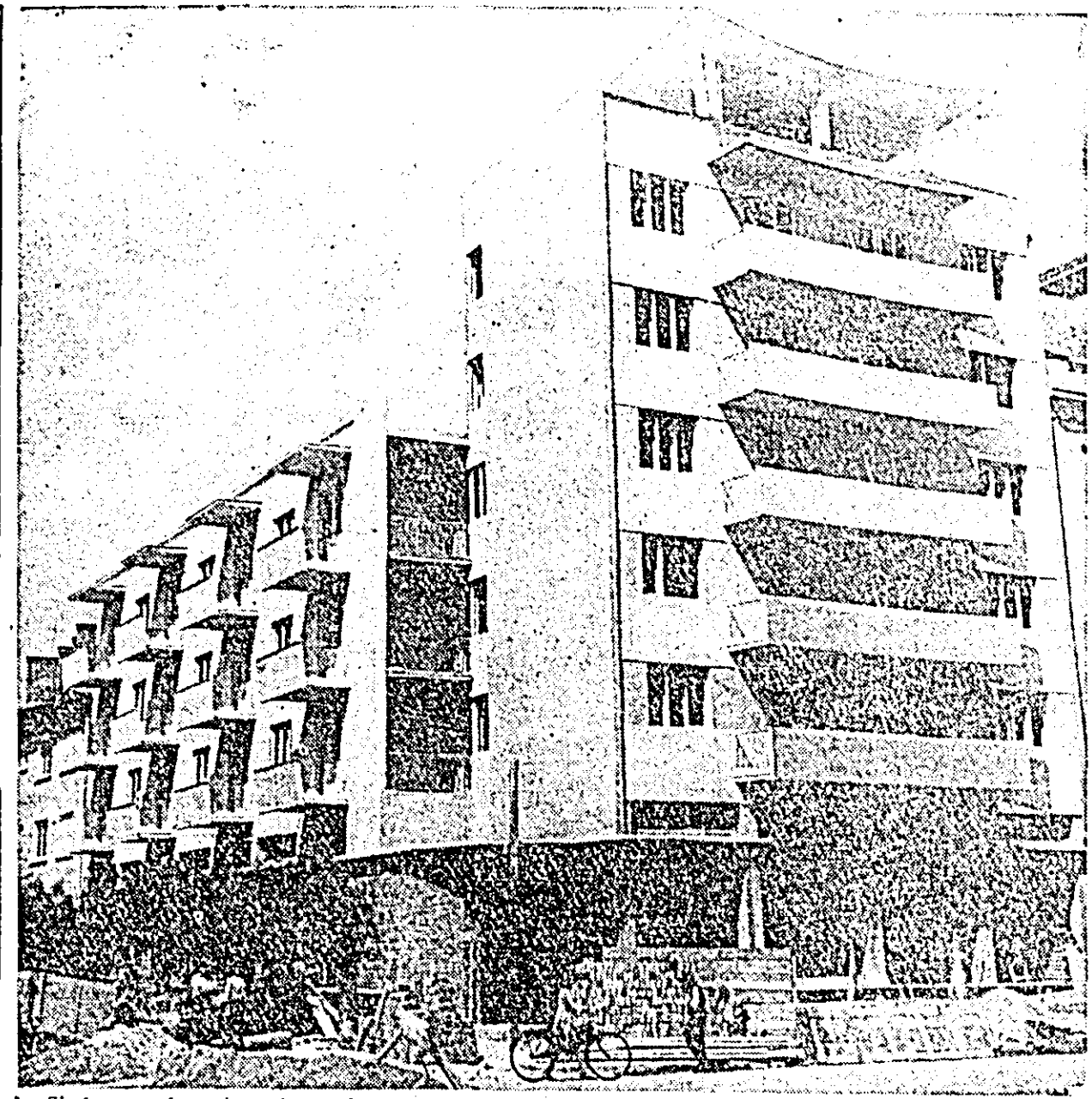
Și în orașul nostru, la fel ca în întreaga țară, tot mai multe sînt locuințele date în folosință oamenilor muncii. Zi de zi, lună de lună se îndeplinesc prevederile Directivelor celui de al III-lea Congres al partidului care arată că pînă la sfîșitul anului 1965 vor fi construite 300.000 noi apartamente.

Amintim pentru cei interesați datele și locurile, cînd și unde se vor organiza excursii prin O.N.T. „Carpații” în luna septembrie: în ziua de duminică, 3 septembrie