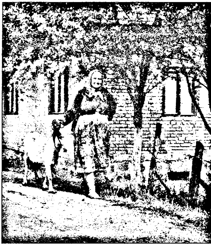
„Oare, doamne, ce să fac, că am capră și n-am țap?”