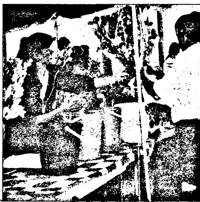
Florile, un lux din când în când totuși necesar ...