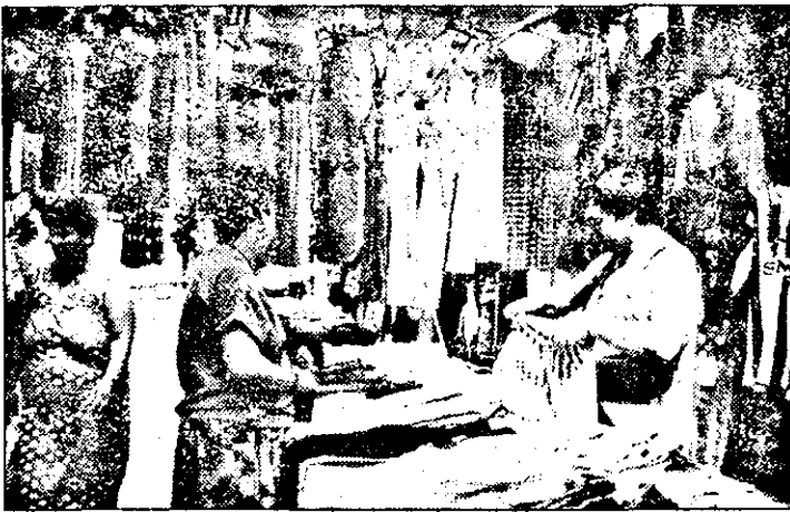
Marfa expusă în piața Solară din Micălaca este ferită de ploii sau de praful ce este omniprezent.

De cealaltă parte, cumpărătorii se plâng de prețurile destul de ridicate și de praful din talciocul Obor. Cu toate acestea nu s-ar putea spune că nu sunt condiții favorabile desfășurării