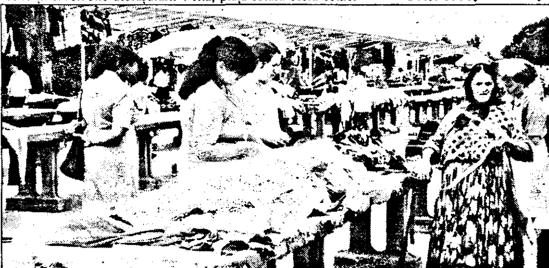
Romii practică, în piața Obor, un comerț haotic, uitând de legile nescrise ale acestui talcioc amenajat.