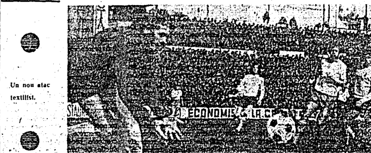
Un nou atac textilist.