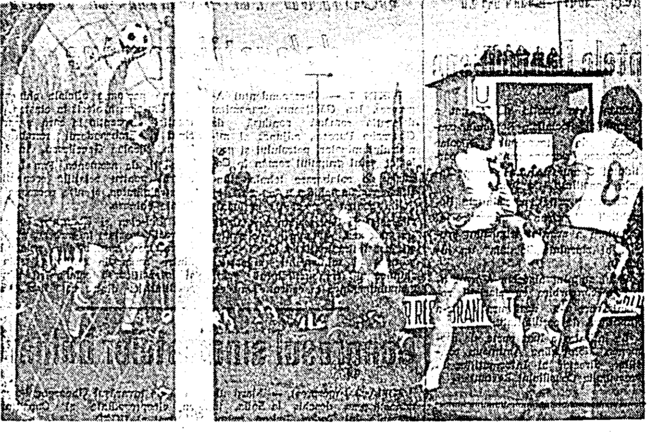
Intervenția salvatoare a portarului englez (autorul țării Sima).