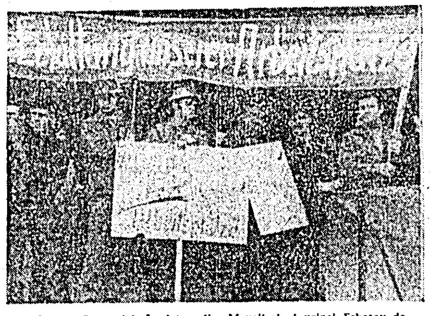
R.F. a Germaniei. În fotografie: Muncitorii al uzinei Eckevy demonstrând împotriva concedierilor. Pe pancarte se poate citi: „Dorim să ne păstrăm locurile de muncă”, „Dorim ca locurile de muncă să ne fie asigurate”.

CAPETOWN 7 (Agerpres) — Secretarul general al Organizației Națiunilor Unite, Kurt Waldheim, întreprinde o vizită de informare, de 48 ore de oră, în Namibia. El face o achetă personală — informează agenția France Presse — în acest teritoriu, care, recent chiar, a cunoscut ample acțiuni ale populației de culoare împotriva regimului de la Pretoria. Înainte de a părăsi orașul Capetown, — anunță agenția France Presse — Kurt Waldheim a avut, în cursul dimineții, o a doua întrevvedere cu primul ministru sud-african, John Vorster.