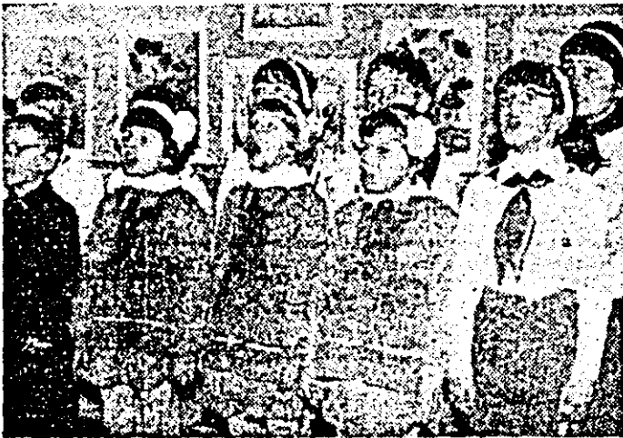
Cu prilejul vernisajului expoziției de pictură dedicată Zilei de 8 Martie, deschisă la clubul presei din Arad, pionierii de la Școala generală nr. 19 au prezentat un emoționant program artistic închinat Zilei internaționale a femeii. În fotografie: moment din spectacol.