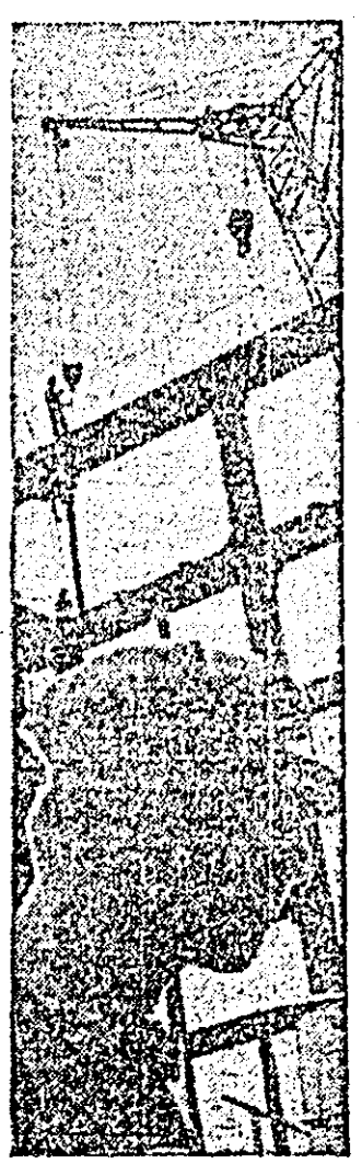
Verticale Industriale pe harta municipiului.

O reușită expoziție cu materiale de propagandă vizuală • Vă prezentăm secția de artă a Muzeului Județean Arad • Agenda linerului • Sport • Civica: Moneasa într-o continuă dezvoltare; Informația pentru toți; Curier juridic; Colțul gospodarului • Actualitatea internațională.