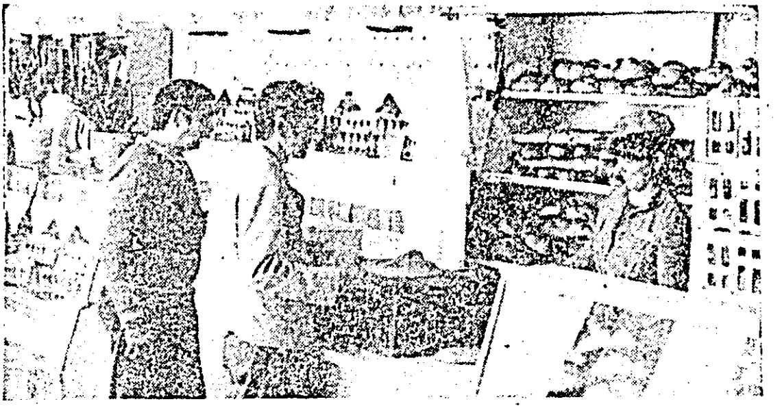
Recent renovată, alimentara nr. 7 „Inlim” oferă solicitanților condiții pentru o servire de calitate.