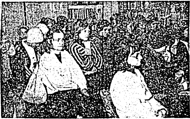
Cenaclul literar de pe lângă biblioteca orășenească din Nădlac constituie o mare atracție pentru tineri, o școală adevărată a talenților ce se străduiesc să-și desăvârșească expresia și în acest colț de țară.