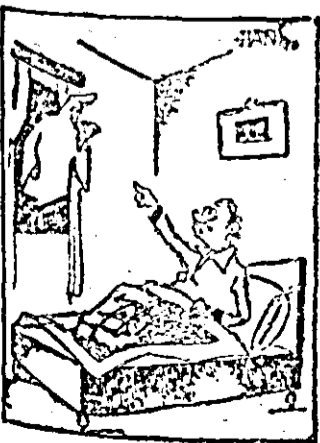
— Dacă nu mă lași în pace, te reclam la miliție!