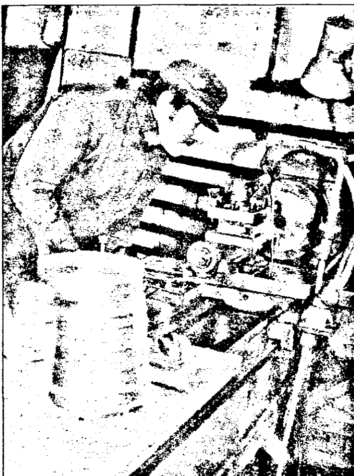
În timp ce marile întreprinderi industriale arădene se sufocă din lipsă de comenzi, un mic atelier particular de prelucrări mecanice, cum este ATELMET SRL din Chișineu-Criș, a reușit să încheie un contract pentru un lot de flanșe chiar și cu un partener din Italia.