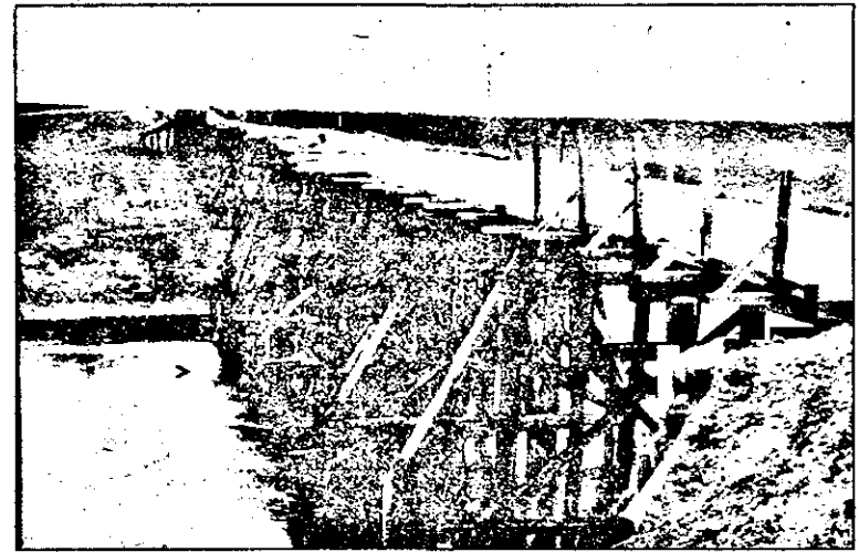
La Vârșand, podul peste Crișul Alb, ajuns în stare de paragină, stă gata să se prăbușească, sub privirile neputincioase ale autorităților locale și disperate ale locuitorilor care, în drum spre terenurile lor, sunt nevoiți să treacă fie pe jos, fie cu utilajele agricole peste acest pod.

mașinile celor care trec zilnic prin această localitate de frontieră. Celelalte probleme, legate de pământ, bani, Legea impozitului pe venitul agricol etc. sunt o altă poveste. EUGENIA BĂRDAȘ