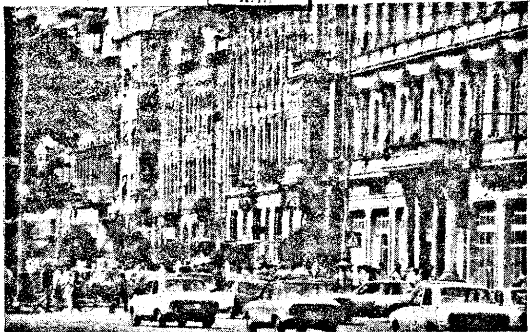
Municipiul nostru cel de fiecare zi...