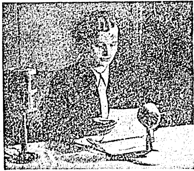
Transmise de către centrul de radioficare. Colectivul de muncă al centrului se străduiește să prezinte cetățenilor faptele cele mai elocvente din viața orașului.

Reportajele culese din diferite întreprinderi și instituții, notele și informațiile transmise relatează munca neobosită pe care o depun oamenii muncii din orașul nostru în vederea realizării sarcinilor de produc-