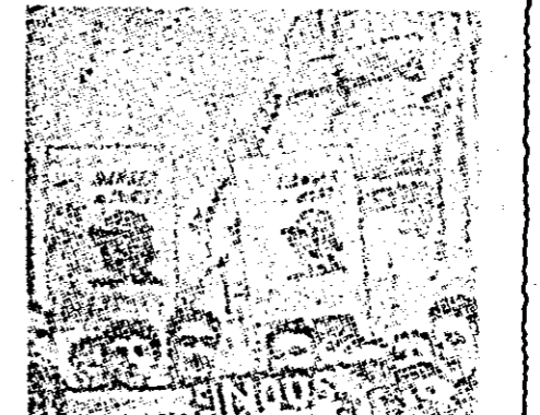
Tinerii muncitori constructori de la întreprinderea „Liberation” (Paris) au organizat manifestații de protest împotriva remilitarizării Germaniei occidentale. În clișeu se poate observa un grup al acestor tineri purtînd placarde antimilitariste. Pe placardele ce reprezintă un soldat hitlerist stă scris: „Pericol de moarte” Alături se află altele pe care scrie: „Noi tinerii de la întreprinderea „Liberation” spunem NU! reînarmării nazistilor”.

TEATRUL DE STAT ARAD: Simbătă, 22 ianuarie, la orele 19,30 „Întîlnire cu tinerețea”. CINEMATOGRAFE „GHEORGHE DOJA”: Campionatele mondiale de fotbal. Repr. la 3,30 5,30, 7,30 și 9,30. „NICOLAE BALCESCU”: Campionatele mondiale de fotbal. Repr. la 3, 5, 7 și 9. Zilnic matineu la orele 11. „HERBAC JANOS”: Alarmă la circ. „I. L. CARAGIALE”: Magazinul de stat (cu Latabăr). „TIMPURI NOI”: 1 Actualitate în imagini. 2. Noutățile zilei. 3. Palatul științei. 4. Palatul pionierilor. 5. Expoziția sovietică de la Copenhaga. „SOLIDARITATEA” (Gai): azi, 21 ianuarie: Călătorie îndepărtată. „ILIE PINTILIE” (Grădiște): Cumpăna. „MAXIM GORKI” (Micălaça), azi, 21 ianuarie: Pentru pace și prietenie. „NICOLAE BALCESCU” (Lipova) Răsare soarele. „PETOFI ȘANDOR” (Radna): Descoperire misterioasă. „POPULAR” (Sînicolaul Mare) Fanfan la Tulipe.