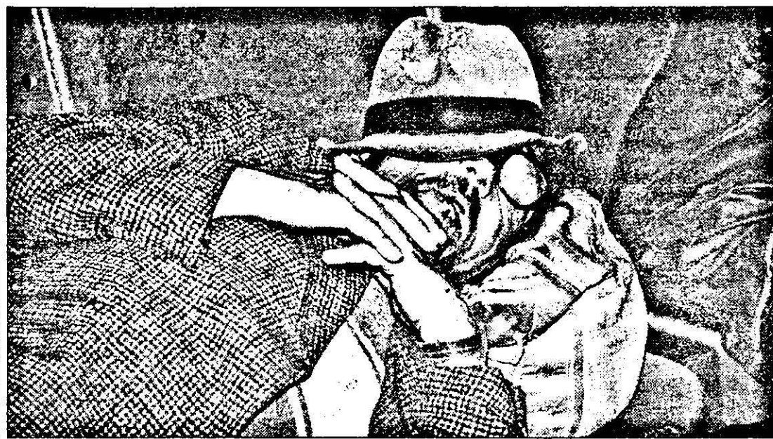
Un alt mod de a protesta. Purtat pe aripile viselor, toate trenurile vor opri în gara Arad.