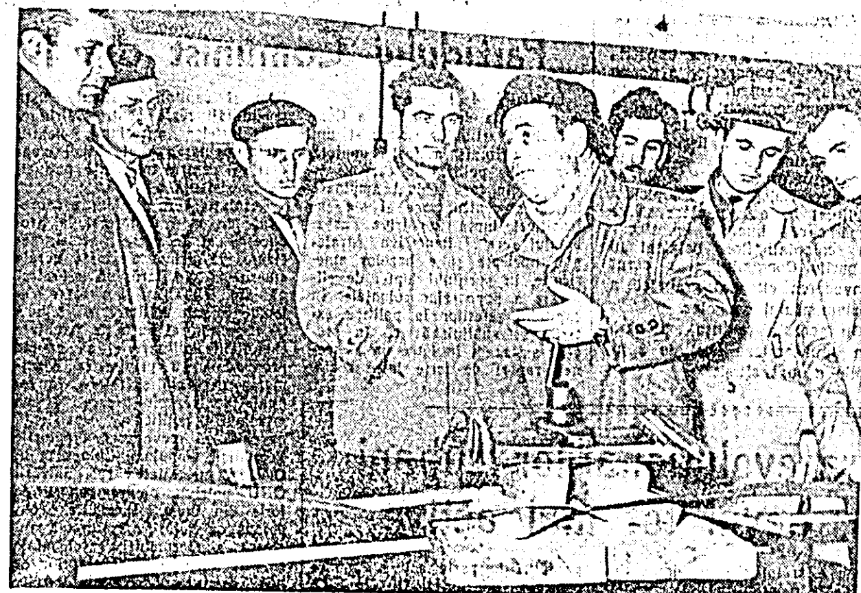
Participanții la schimbul de experiență ascultă explicațiile privind calitatea operațiilor care se execută la circularul automat de tivit cherestea.

dicării calității mobilei curbate — așa cum indică Directivele C.C. al P.M.R. cu privire la criteriile principale ale întrecerii socialiste în cinstea aniversării a 40 de ani de la înființarea partidului, — Direcția generală a industriei produselor finite din lemn, în colaborare cu C.C. al Unitii Sindicatelor muncitorilor din întreprinderile forestiere, a organizat un rodnic schimb de experiență la IPROFIL „Răsăritul“ din Pîncota, cu participarea tuturor întreprinderilor producătoare de mobilă curbată din țară. Redăm mai jos aspectele de la acest schimb de experiență.