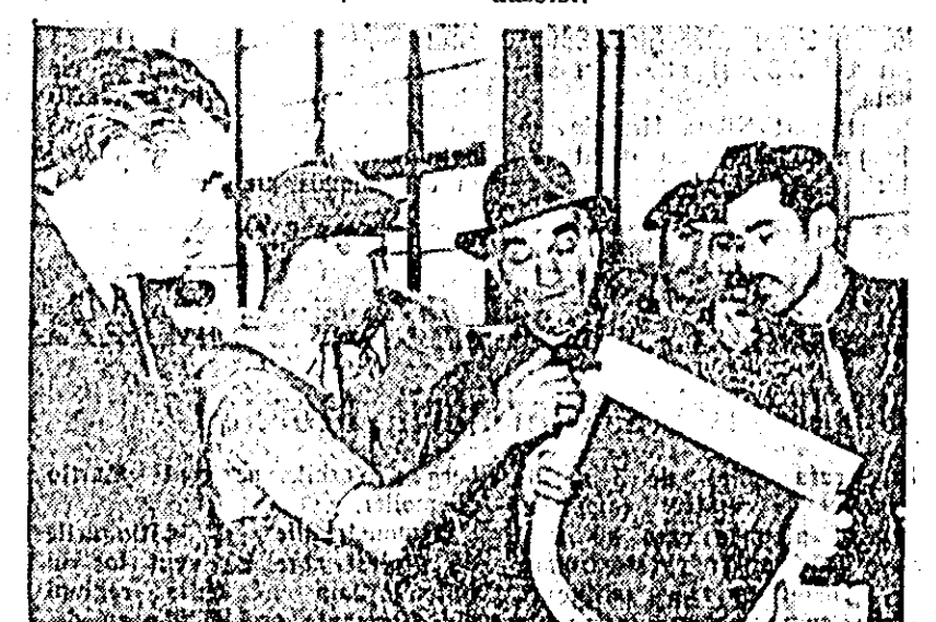
În clișeu: În camera de odihnă a pieselor, participanții la consfătuire analizează stadiul lor de uscare.

— La confecționarea ramei de șezut se execută 3 operații. La fabrica de la Balta Sărăț, s-a confecționat un dispozitiv care execută frezatul exterior, rotunjitul și tălăul la ferăstrău, înlocuind deci aceste 3 operații cu una singură, metodă ce ar putea fi aplicată și la Pîncota.