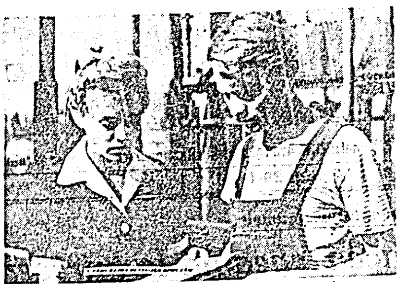
Pe ecranul cinematografului „Gh. Doja” rulează filmul

Faza orașenească a celui de al VI-lea concurs a constituit un bun schimb de experiență între echipele artistice. Subliniind drumul ascendent al mișcării artistice de amatori, concursul a scos totodată la iveală și unele deficiențe care mai există în munca artistică. Organizațiile de partid și comitetele de întreprindere sînt datorate să analizeze felul în care s-au comportat formațiile de amatori, să le îndrume cu mai multă grijă, în alegerea repertoriului și prezentarea acestuia la un nivel artistic ridicat. V. SARDIU