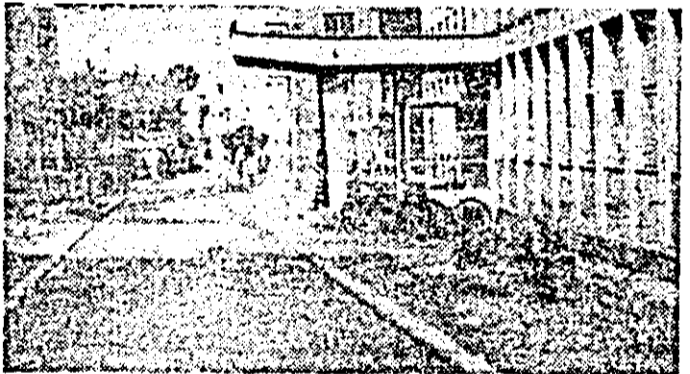
Prezentă e însă din păcate și neglijența, ca în fața modernăi Policlinici, unde se vede o grămadă de gunoi, iar bicicletele sînt parcate pe spațiul verde.