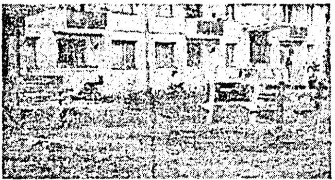
O altă pildă rea, tot pe strada Dunării, la nr. 5-7, în fața blocului 43, ce nu a scăpat aparatului de fotografiat: gunoi, bănci deteriorate, neglijență.