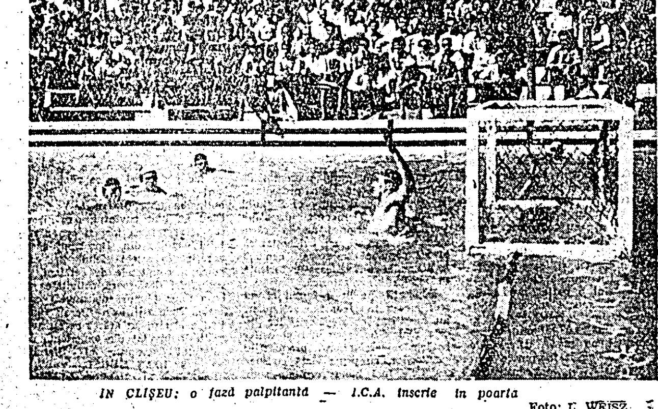
IN CLISEU: o fază palpitantă — I.C.A. înscrite în poarta

Partida la astfel sîrșit cu rezultat de 2:1 pentru ICA. Au jucat mal bine, de la Barna, Breban, Varga și Vessier. De la oaspeții s-au remarcat: Ictrovid, Barani, Hupfi și Klein. Formațiile celor două echipe: ICA: Vessier — Negru, Varga, Hupfi, Leac (Huplea II din minutul 64). Pomerschein, Barna, Erdely. ELECTROMOTOR: Gorbos — Denes, Ban, Bürger — Petrovici, Barani — Tolpai, Hupfi, Klein, Barbu.