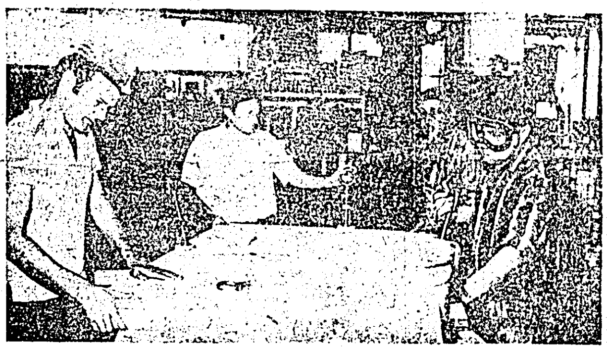
Secvență de muncă la timpieria Uzinelor de vagoane Arad.