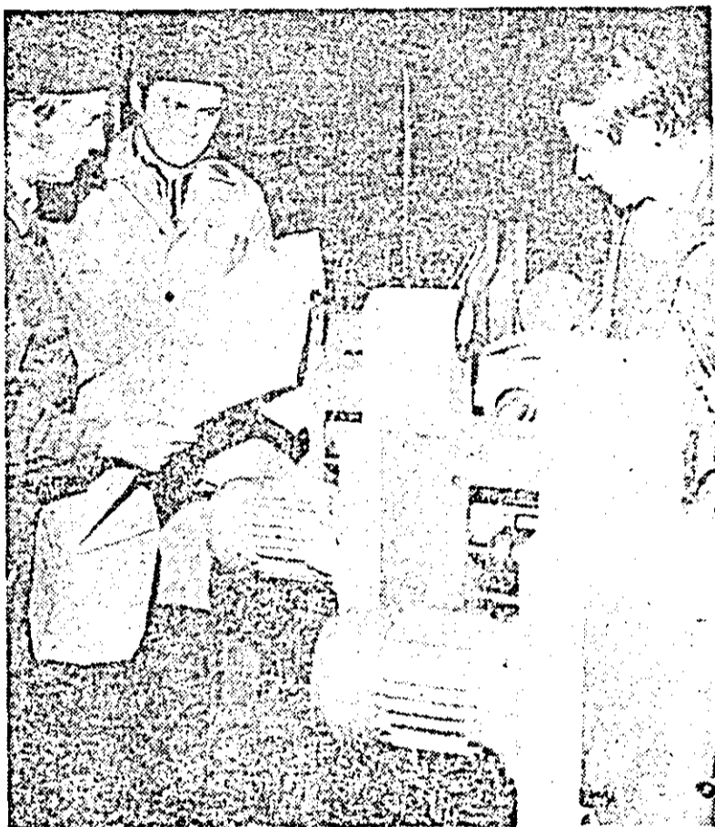
Intregul angrenaj al cutiilor de avans este tipizat pentru toate familiile de strunguri revolver.

P. VAIDA: Nomenclatorul produselor standardizate la noi a fost restrîns, proiectanții fiind obligați să folosească un număr redus de sortitipodimensiuni. Ar mai fi o problemă: la asimilarea unor produse din import se impune ca o serie de repere să fie înlocuite cu cele existente în standardele noastre, pentru a nu se crea noi tipodimensiuni. Din alt punct de vedere considerăm că acțiunea de tipizare s-ar solda cu rezultate mult mai bune dacă în-