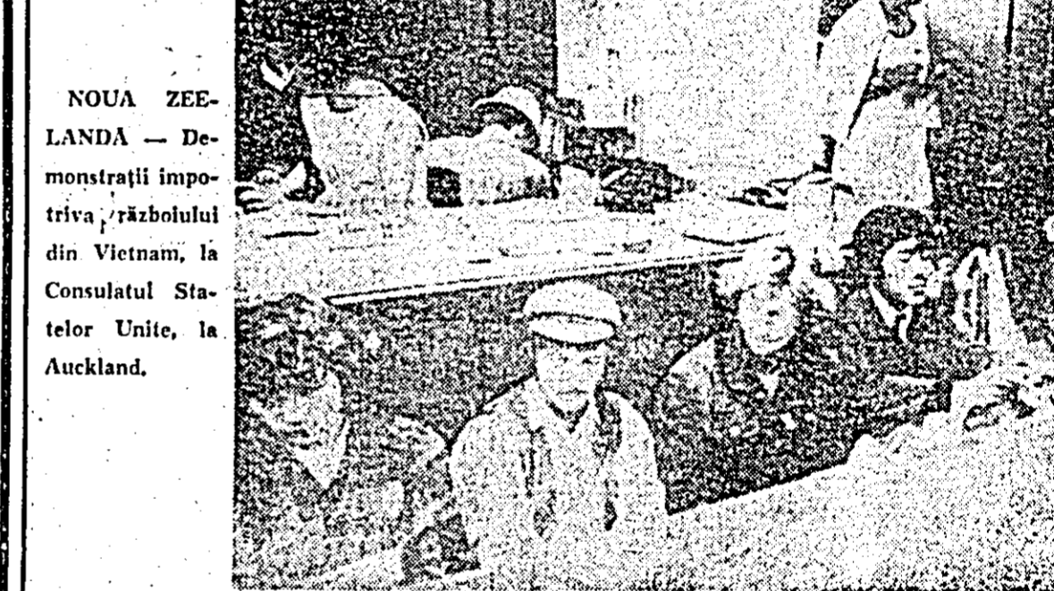
NOUA ZEE-LANDA — Demonstrații împotriva războiului din Vietnam, la Consulatul Statelor Unite, la Auckland.

AMMAN 26 (Agerpres). — Numai o zi după constituirea noului guvern iordanian, condus de Abdel Moneim Rifai, a reunit sub președinția regelui Hussein al II-lea.