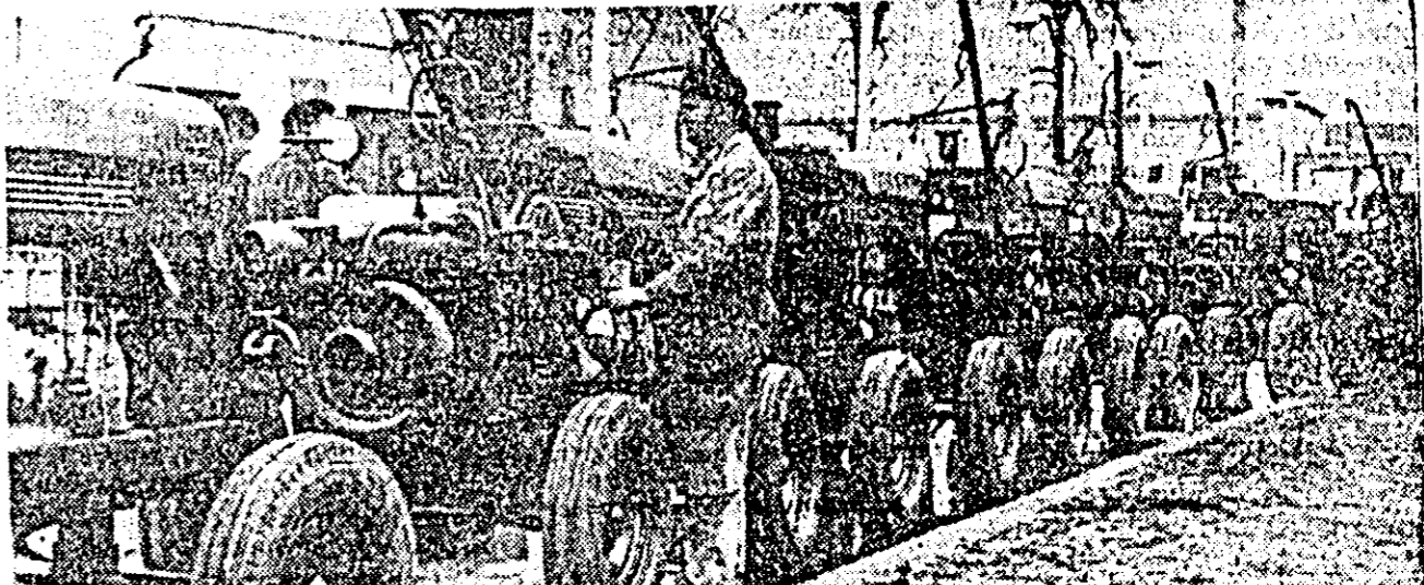
Un nou lot de agregate pentru pompare (A.P.T.—4N) realizate de către Uzina de reparații. Arad iau drumul agriculturii.