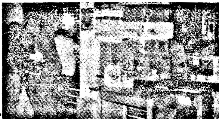
In clădirea vămii Nădlac, cetățenii stau la rînd la taxe, iar mărfurile confiscate, care nu mai încap în magazii, își așteaptă, de mult, rîndul la... licitație!