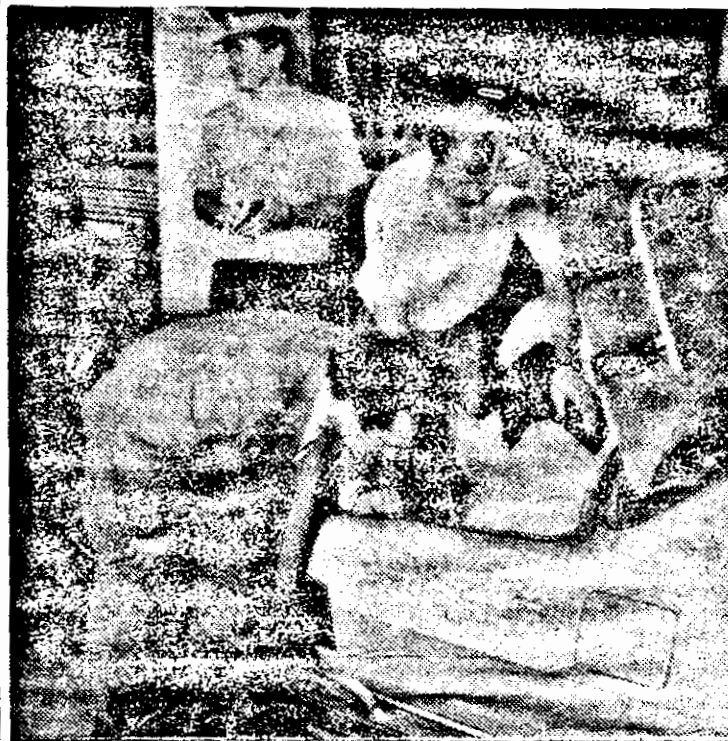
Pe drumul „întrării” în Europa, cu câșel, cu purcel și cu... benzind.