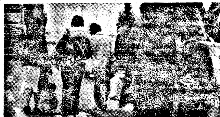
— Iar ne-am întors de la vamă! Și aveam de vînzare niște crăițe, prima-lux! Ce, noi nu avem voie să luăm export?