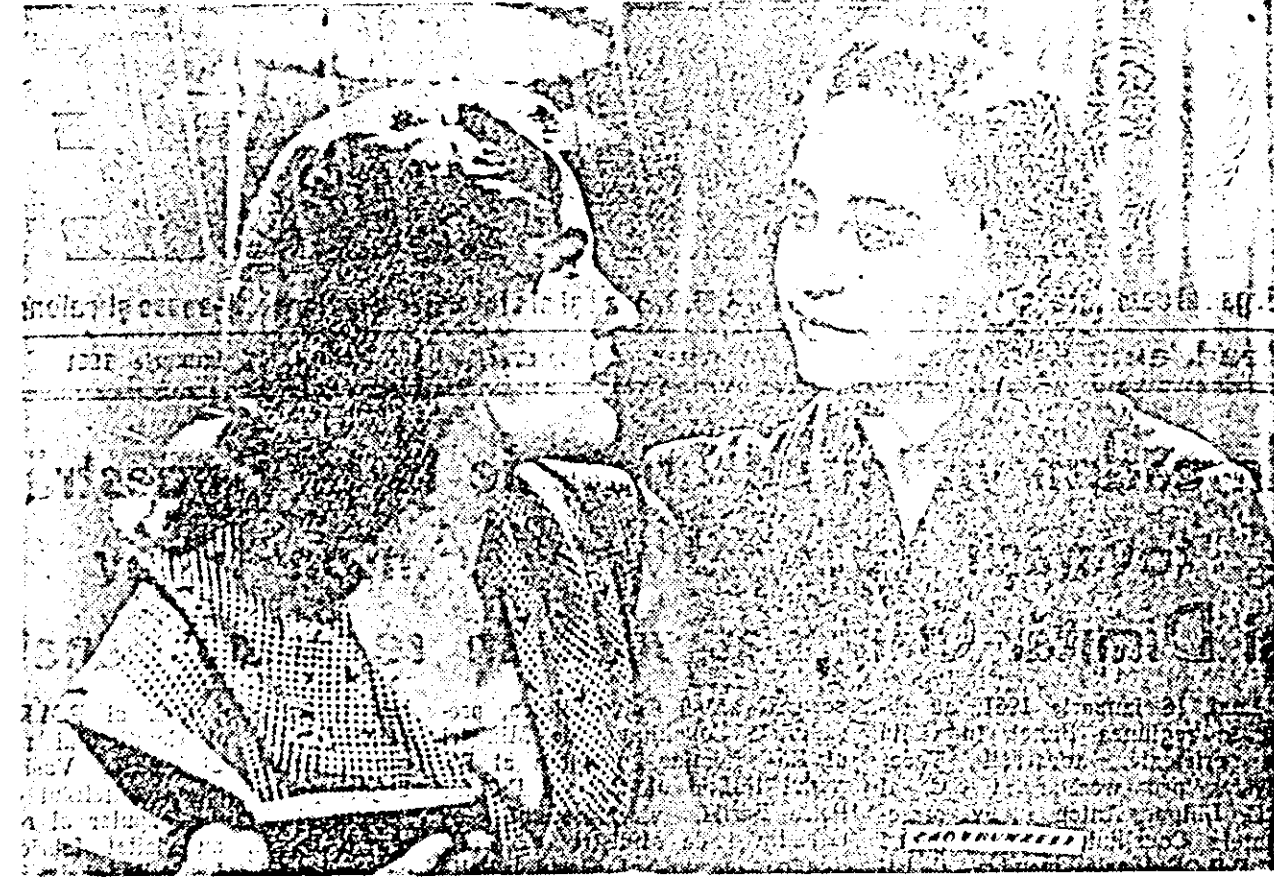
Pe ecranul cinematografului „N. Bălcescu”

Cabinetul tehnic studiază acum cea de-a doua propunere privind construirea unui cuplor pentru tratamentul termic al segmentelor pistoanelor de la locomotivă. Prin această inovație segmentul vor primi un tratament, care va duce la mărirea durabilității cu 25 la sută. Pe această cale se vor obține economii anuale de circa 10 mil lei.