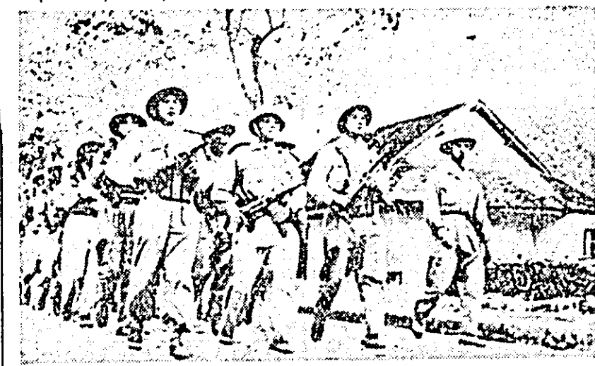
IN CLISEU: Un detașament al formațiunilor Patet-Lao mărșăluind în urmărirea rebelilor.

După cum transmite corespondentul din Vientiane al agenției France Presse, o mare parte din poliția orașului Vientiane, precum și funcționari ai instituțiilor administrative au fost mutați din Vientiane la Savannaket. Această acțiune este considerată ca începutul înlăturării planului de mutare a capitalei administrative a Laosului la Savannaket — punctul de sprijin al rebelilor, situat în sudul Laosului. Planul prevede ca în cazul cînd trupele căpitanului Kong Le și trupele Patet Lao vor începe ofensiva împotriva orașului Vientiane, acest oraș să nu fie apărat.