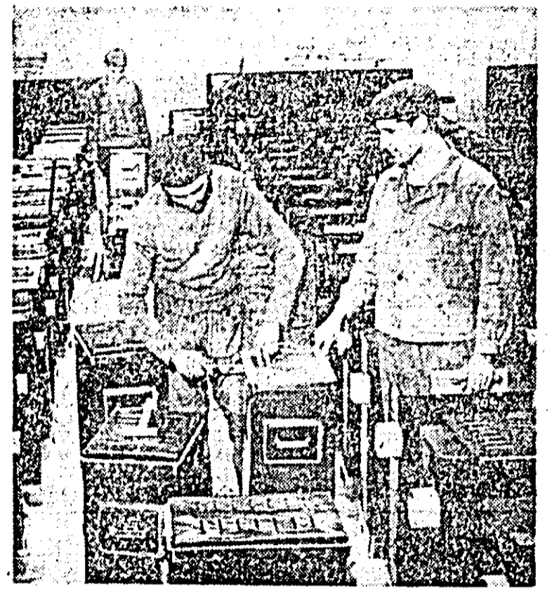
Se execută un ultim control la un nou lot de sobe de încălzit la uzina „Ciocanul” din Nadrag.