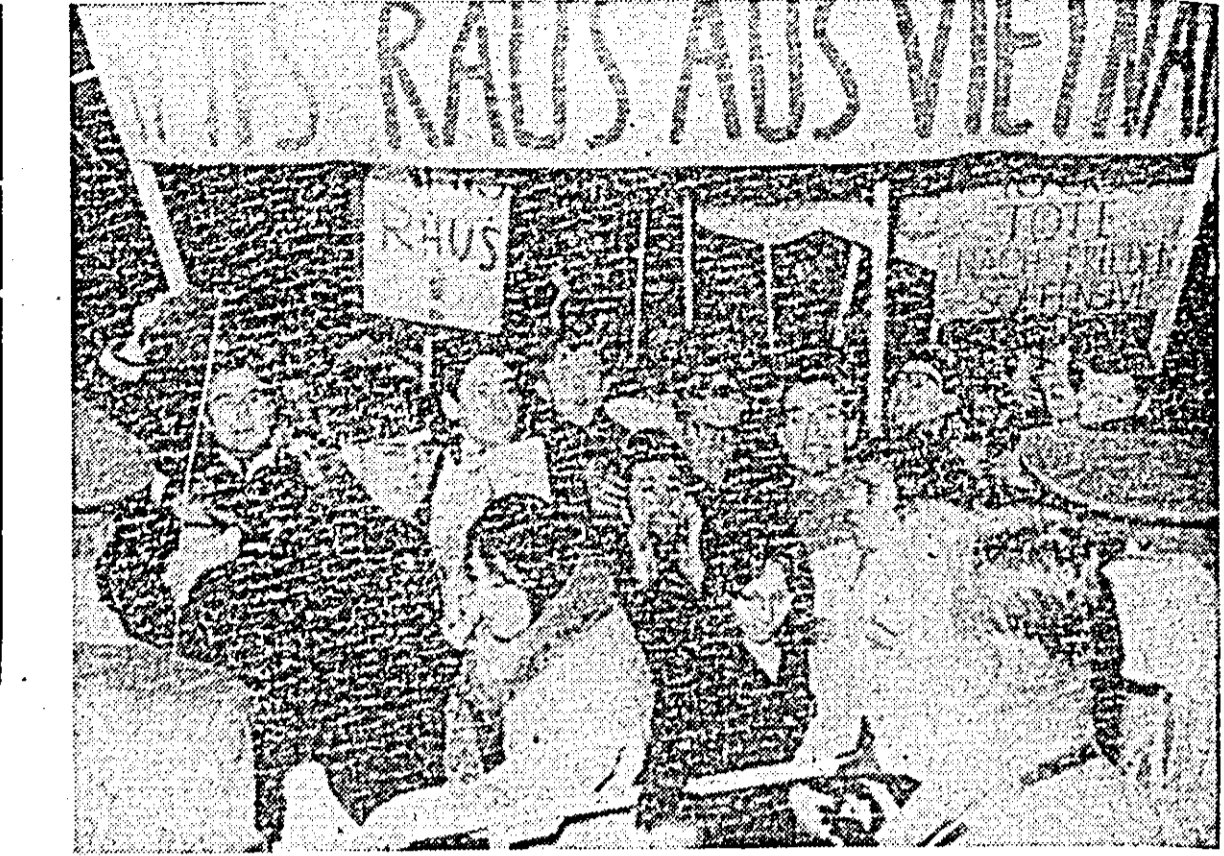
Aspect de la demonstrația muncitorilor și studenților care a avut loc recent la München (Republica Federală Germană) în fața consulatului general al S.U.A., împotriva politicii americane în Vietnam. Peste 200 de poliști au încercat să oprească valurile de demonstrații. Pe pancarte din prim plan se poate citi: „Americani să părăsească Vietnamul!”

Brazilia este în prezent cel mai mare producător de cafea din lume. Producția sa anuală se ridică la 33 milioane saci a câte 60 kg, ceea ce reprezintă jumătate