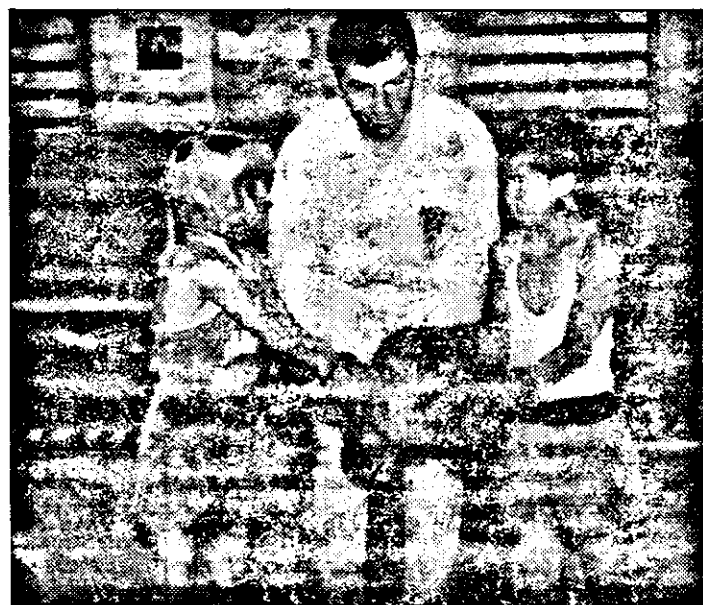
„Cel mai bun să câștige” - le spune arbitrul de ring micușilor pugiliști.