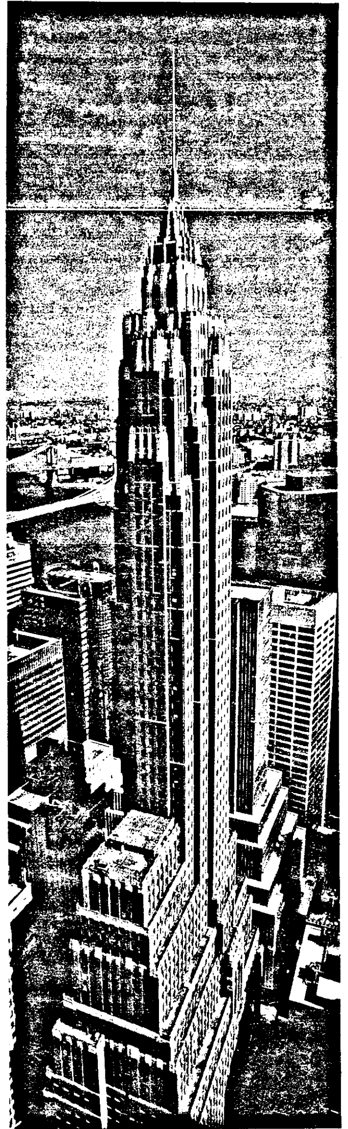
Sediul AIG din New York

După toate cifrele menționate înainte, banii par obsesia noastră. Dar banii sunt doar un mijloc. Siguranța financiară pe care o oferim noi se traduce în cele din urmă în liniște sufletească . Acesta este lucrul pe care îl oferim, pentru multă vreme de acum înainte.