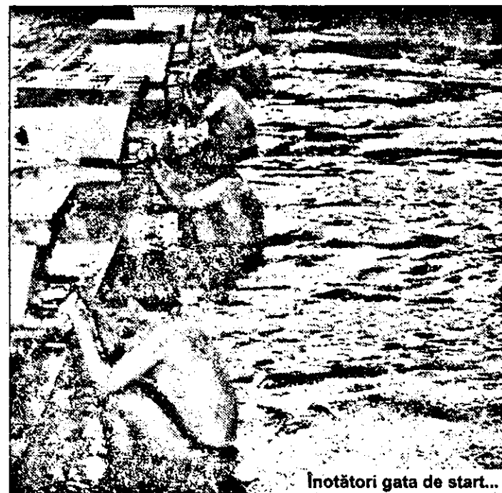
Înotători gata de start...