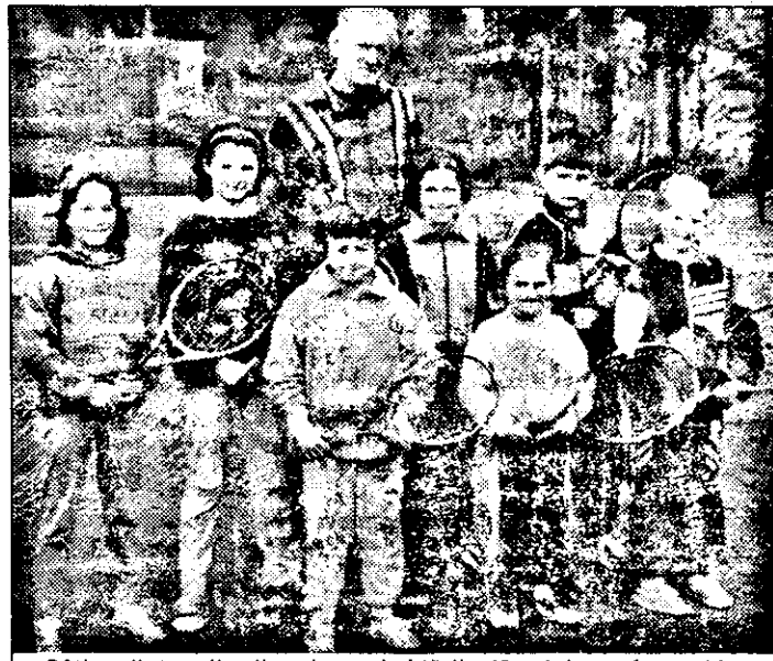
Cățiva dintre viitorii tenismeni ai țării, alături de profesorul lor.