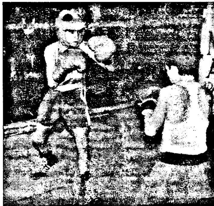
Și cei mici pot oferi faze spectaculoase din nobila artă.