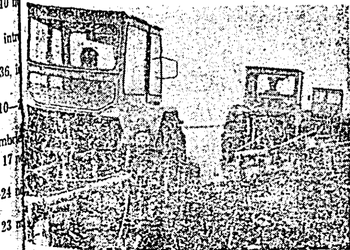
...agarele consiliului agroindustrial Gurahont, arăturile sunt avansate, urmând ca în câteva zile lucrarea să fie în-