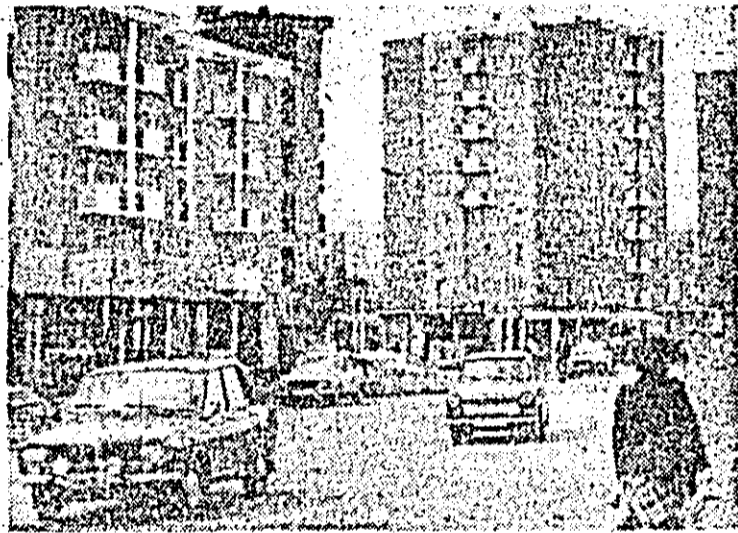
Plaza UTA, o zonă a municipiului aflată și ea în plină modernizare și dezvoltare.

Recuperarea restanțelor, îndeplinirea planului la toți indicatorii — obiectiv prioritar dar și angajament unanim, din cîte am constatat, al tuturor oamenilor muncii de la secția montaj, al întregului colectiv muncitoresc al întreprinderii.