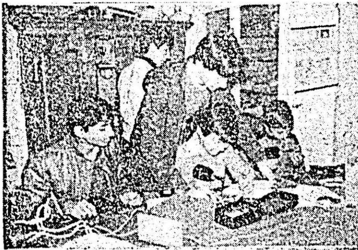
Casa pionierilor și școlilor patriei Nădlac. Micii rađionişti în plină activitate.