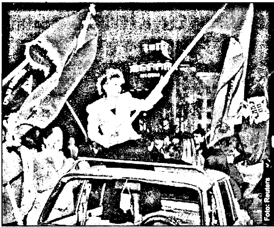
Simpatizanții Partidului Radical Sârb, manifestându-și satisfacția față de rezultatele referendumului prin care 95 la sută din populație s-a pronunțat împotriva medierii internaționale a conflictului din Kosovo.

Avionul ucrainean a părăsit țara în dimineața următoare descărcării țigaretelor.