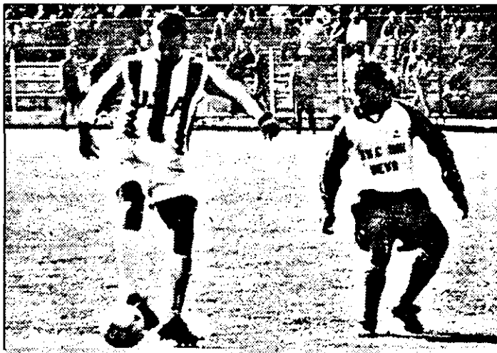
Dacă în tur UTA a câștigat cu un scor strâns (3-2), acum, la Deva, arădenii au învins detașat: Vega - UTA 0-4.

denilor, Ciubăncan aflat în careu la 10 m de poartă șutează prea încet