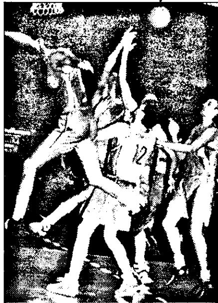
Aparențele înșală. În realitate, WEST PETROM a învins mai ușor decât reieșe din această fază.