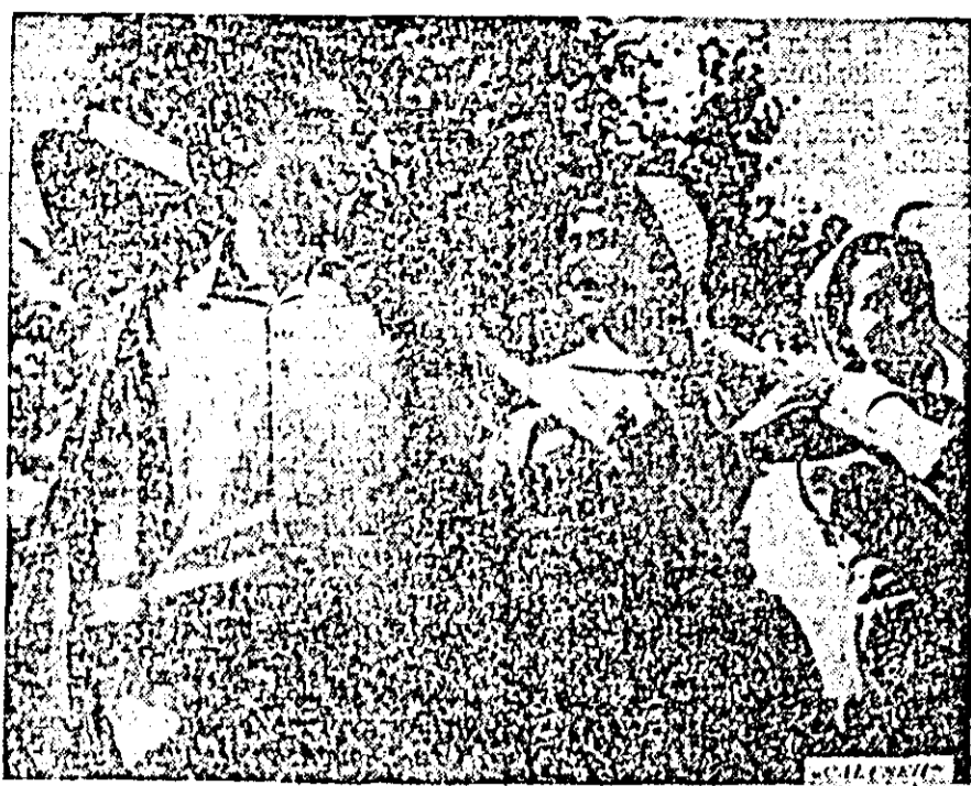
IN CLIȘEU: o scenă din film.

Și în film ca de altfel și în viață și-a dovedit viabilitatea vechea zicală populară că în dragoste 2x2 = cîteodată 5. Cine nu ține cont de acest adevăr pățește ca Sandor. Filmul "Călușei", prin noutatea subiectului, prin modul nou în care sînt abordate problemele vieții, prin soluțiile găsite în favoarea declanșării cu vigoare a tot ce e nou alături de viața satelor etc și în conștiința tinerilor, constituie o frescă autentică a vieții de la țară în toată complexitatea ei. Filmul este o operă de un umanism răscolitor nu numai prin episoadele dramatice ale luptei dintre tată și fiică, ci și prin modul în care noul își croșește drum împotriva a tot ce e vechi și perimat. Scene ca: