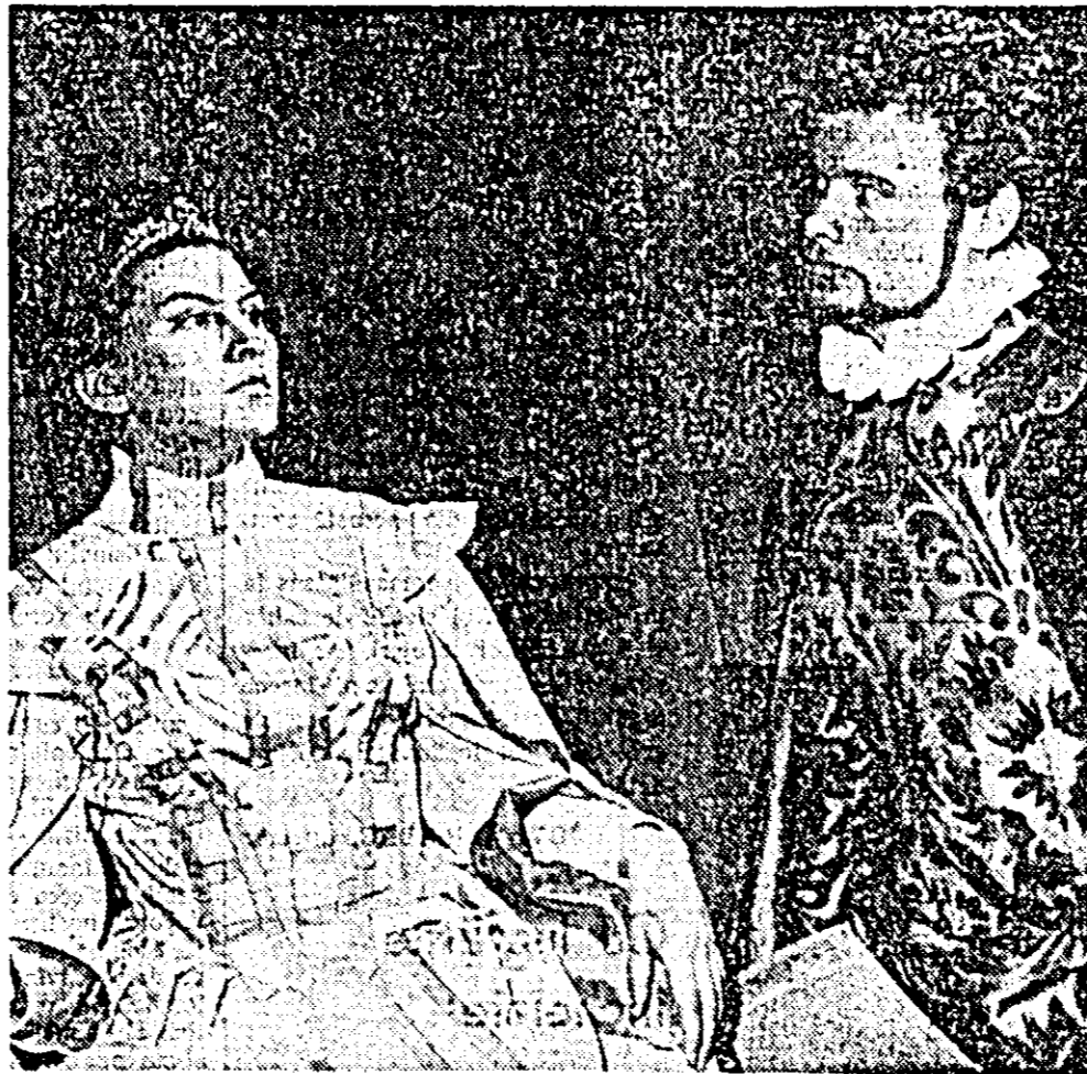
O scenă din piesa „Don Carlos”

Deși foarte bolnav și obosit, Schiller continuă să lucreze cu o febrilitate neobișnuită la noi lucrări literare din care multe se înscriu printre capodoperele literaturii dramatice universale. Dintre acestea, „Wilhelm Tell” (1804) — cea din urmă lucrare a lui Schiller, atinge o culme a întregii sale creații. Poetul, care și-a înmuaiat de altceva ori pana în valurile urii contra împăraților, ridică în Wilhelm Tell un