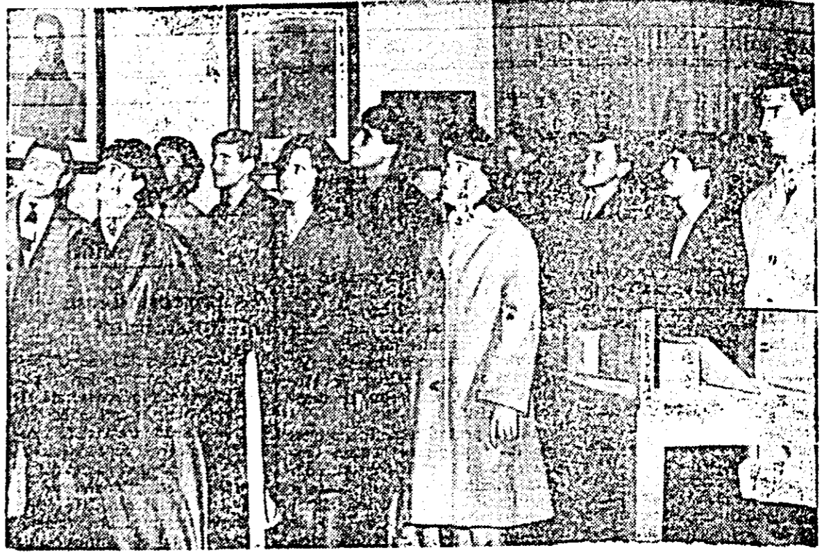
Muzeul regional din Arad oferă largi posibilități de acumulare de noi cunoștințe. De aceea el este vizitat zilnic de un mare număr de tineri. Aparatul fotografic surprinde un grup de elevi din școlile arădene, vizitînd una din secțiile muzeului.