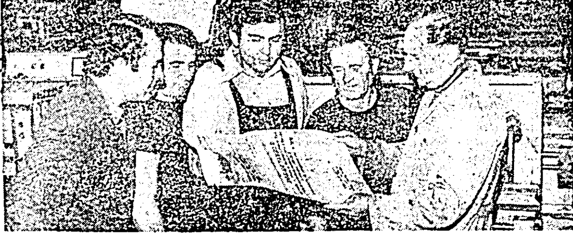
La întreprinderea de strunguri a sosit ziarul „Scinteia” cu proiectul de Directive.

Aceleași cerințe de calitate superioară a muncii le pune proiectul de Directive și în agricultura, în industria și în telecomunicații, în cercetarea științifică și învățământ — ramuri ale dezvoltării economice și sociale a țării ce vor cunoaște în cincinalul următor și în perspectivă, până în 1990, o tot mai puternică afirmare. Fiecare, înlăturarea exemplară a tuturor obiectivelor înscrise în proiectul de Directive, ridicarea continuă a eficienței economice a întregii activități va crea condiții pentru majorarea în cincinalul următor cu încă 16-18 la sută a retribuțiilor celor ce muncesc, a veniturilor reale ale țărănilor, a pensilor ș.a.m.d. Primind cu deosebit interes proiectul de Directive, însușindu-și și aproblemă din toată inima prevederile cuprinse în acest strălucit document programatic, comuniștii, toți oamenii muncii din județul Arad — români, maghiari, germani și de alte naționalități — sint ferm hotărâți să dovedească prin fapte că vor împlini cea de-a 35-a aniversare a eliberării țării și Congresul al XII-lea al P.C.R. cu noi și semnificative succese în toate sectoarele de activitate.