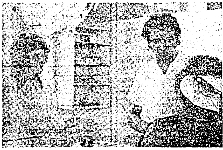
La sănătatea populației din Nădlac veghează opt medici și 20 cadre sanitare medii. De curând s-a dat în folosință o micropoliclinică dotată cu aparatură medicală modernă...