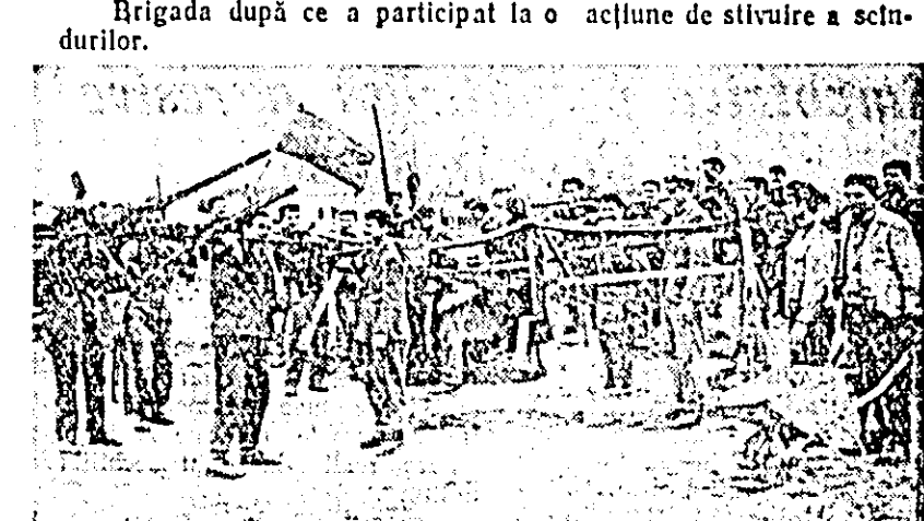
Brigada după ce a participat la o acțiune de strîngere a scindurilor.