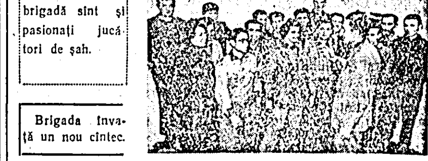
Tinerii din brigada sînt și pasionați jucători de șah.