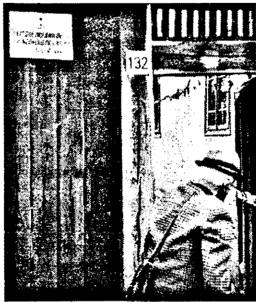
Pescari 132, o firmă P. O. P. R., sediul central