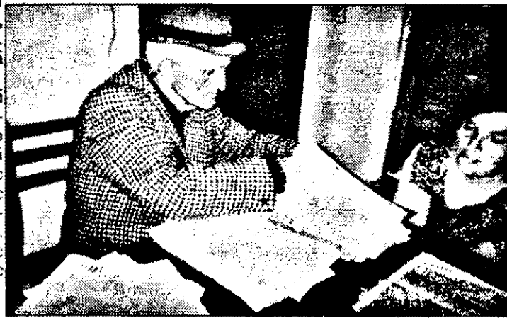
„N-am venit în Pescari să ne uităm la corupția ce-i aici. Am acte, am martori și știu Codul Penal pe de rost.”