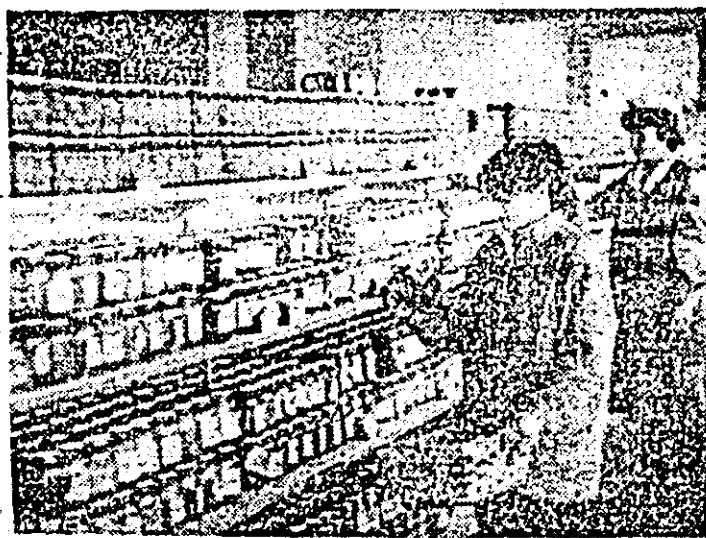
Aspect din magazinul alimentar cu autoservire din Piața UTA.