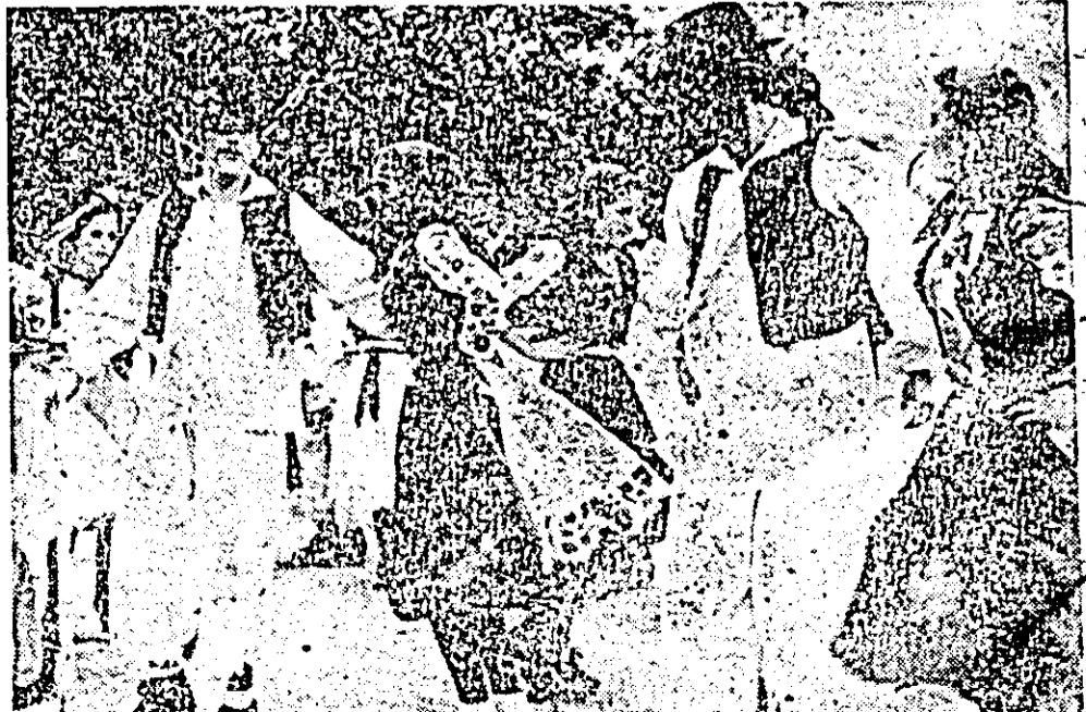
Mîndru-i jocul românesc...