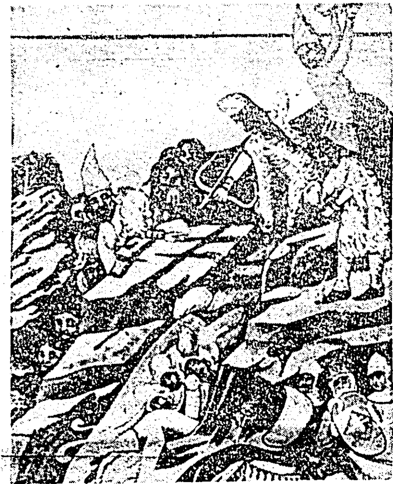
BĂTALIA DE LA POSADA. Reproducere din Cronica pictată de la Viena.

Victoria obținută în 1330 de domnul Basarab la Posada a consolidat independența Țării Românești, a dovedit puterea noului stat românesc și, în același timp, l-a asigurat o dezvoltare liberă.