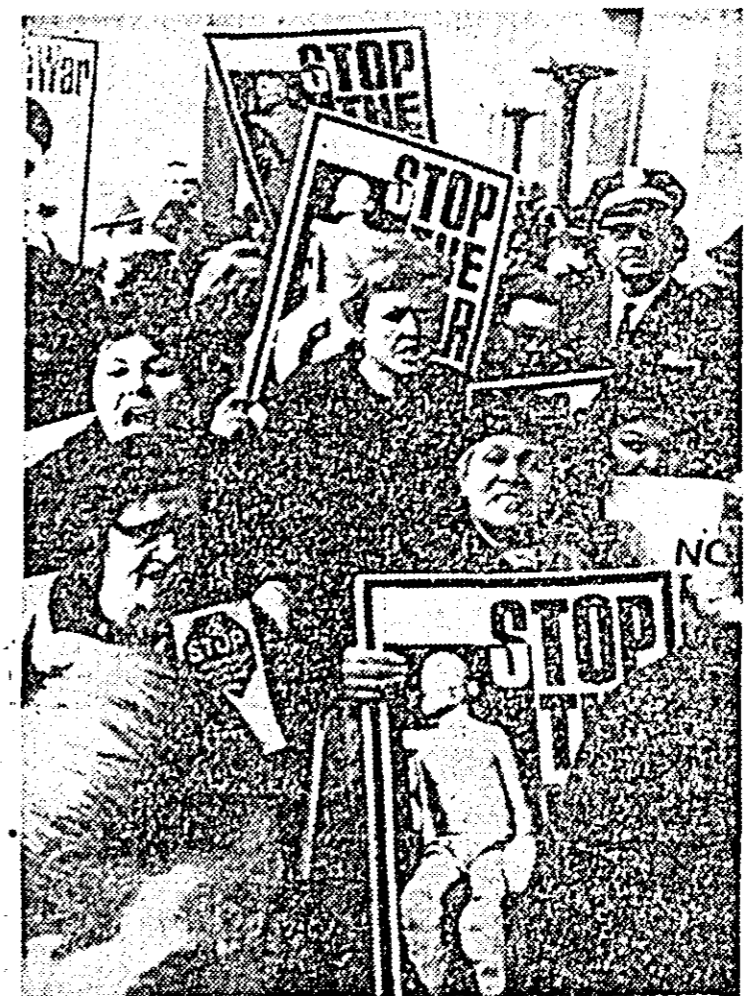
Peste 2.500 de femei din mai multe state ale SUA (printre care New York, Massachusetts, Pennsylvania), au organizat zilele trecute o demonstrație de protest în fața Pentagonului...

Curcile oficiale londoneze declară că, în ciuda schimbării atitudinii premierului maltez, este încă greu de prevăzut rezultatul tratativelor maltezo-britanice care vor avea loc.