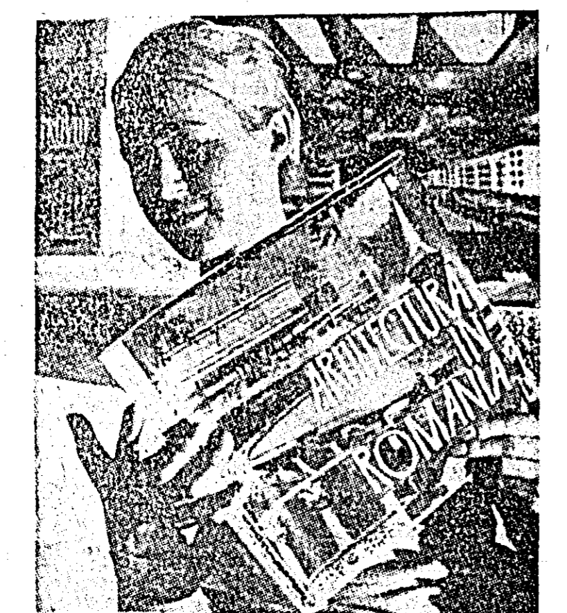
Recent, la Frankfurt pe Main s-a deschis Expoziția cărții românești organizată de Centrul Editurilor și Difuzării Cărții din țara noastră în colaborare cu Societatea pentru expoziții și tirguri a Uniunii librăriilor din R.F. a Germaniei.

doi șefi de stat, la care au participat miniștrii lor de externe, au avut loc convorbiri între miniștrii economiei ai celor două țări, în cadrul cărora au fost abordate măsurile menite să ducă la o dezvoltare a schimburilor comerciale dintre Irak și Turcia.