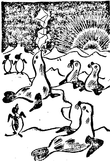
Az idomított foka megszökött a cirkusból és visszatért övéi közé.

— 200.000 leire büntették az aradi cukorgyárat. Bucurestiből jelentik: A nemzeti munka védelméről szóló törvény alkalmazására kiküldött bizottság tegnap Leon alminiszter elnökletével ülést tartott s átvizsgálta a bizottság elé terjesztett személyzeti kimutatásokat. A bizottság tegnap a következő büntetéseket róta ki: Pinz Testvérek (Satumare) 200 ezer, Unio gépgyár (Satumare) 100 ezer, az aradi cukorgyár 200 ezer, chitilai cukorgyár 50 ezer, Stollwerck cukorgyár 100 ezer, Hans Heinrich 50 ezer, Fildermann-malom (Bacau) 50 ezer, Schwarzberg Jacob (Chisinau) 80 ezer lei pénzbírság.