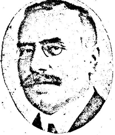
DI. DR. ANGELESCU Ministrul Instrucției