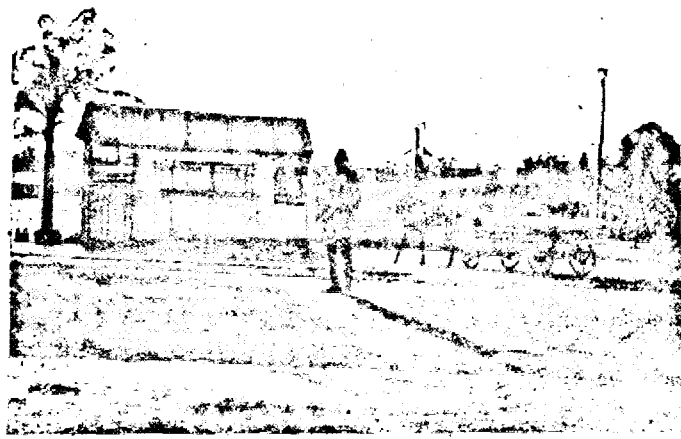
Tip de bodegă „High-Life” din Piața Mihai Viteazu