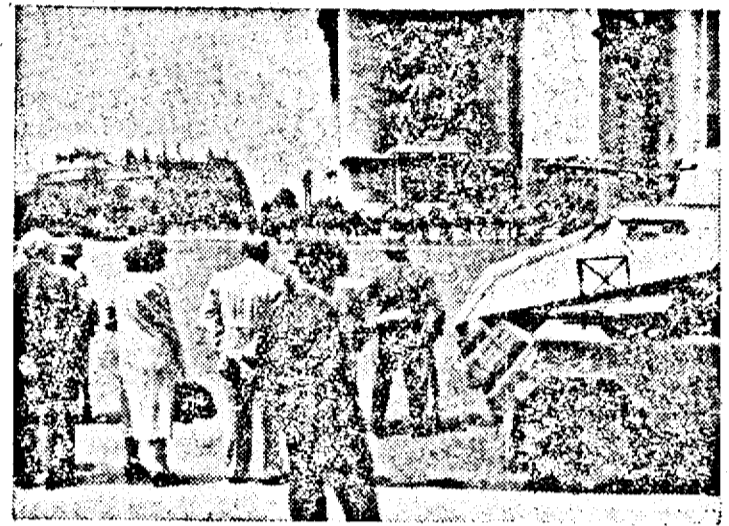
Populația civilă a Parisului privind detașamente de ale armatei germane în Plăcu de l'Étoile