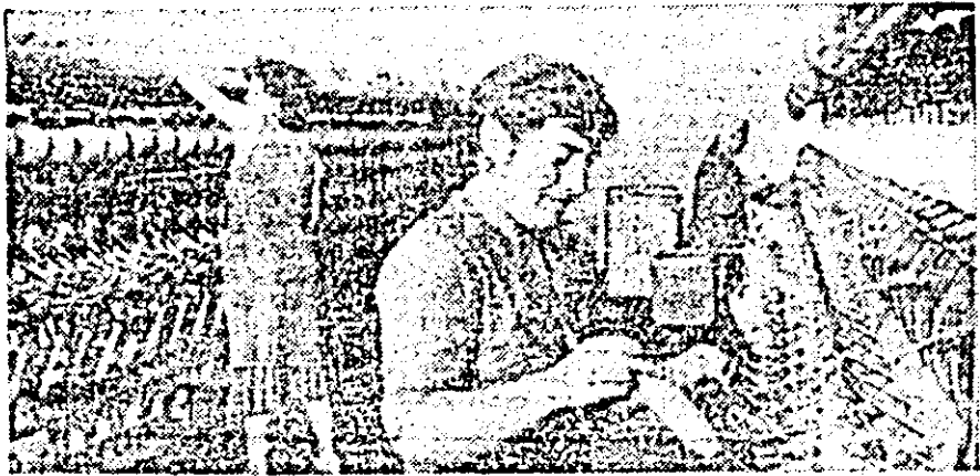
Aspect de muncă în atelierul pregătire al întreprinderii „Tricolor roșu” Arad.