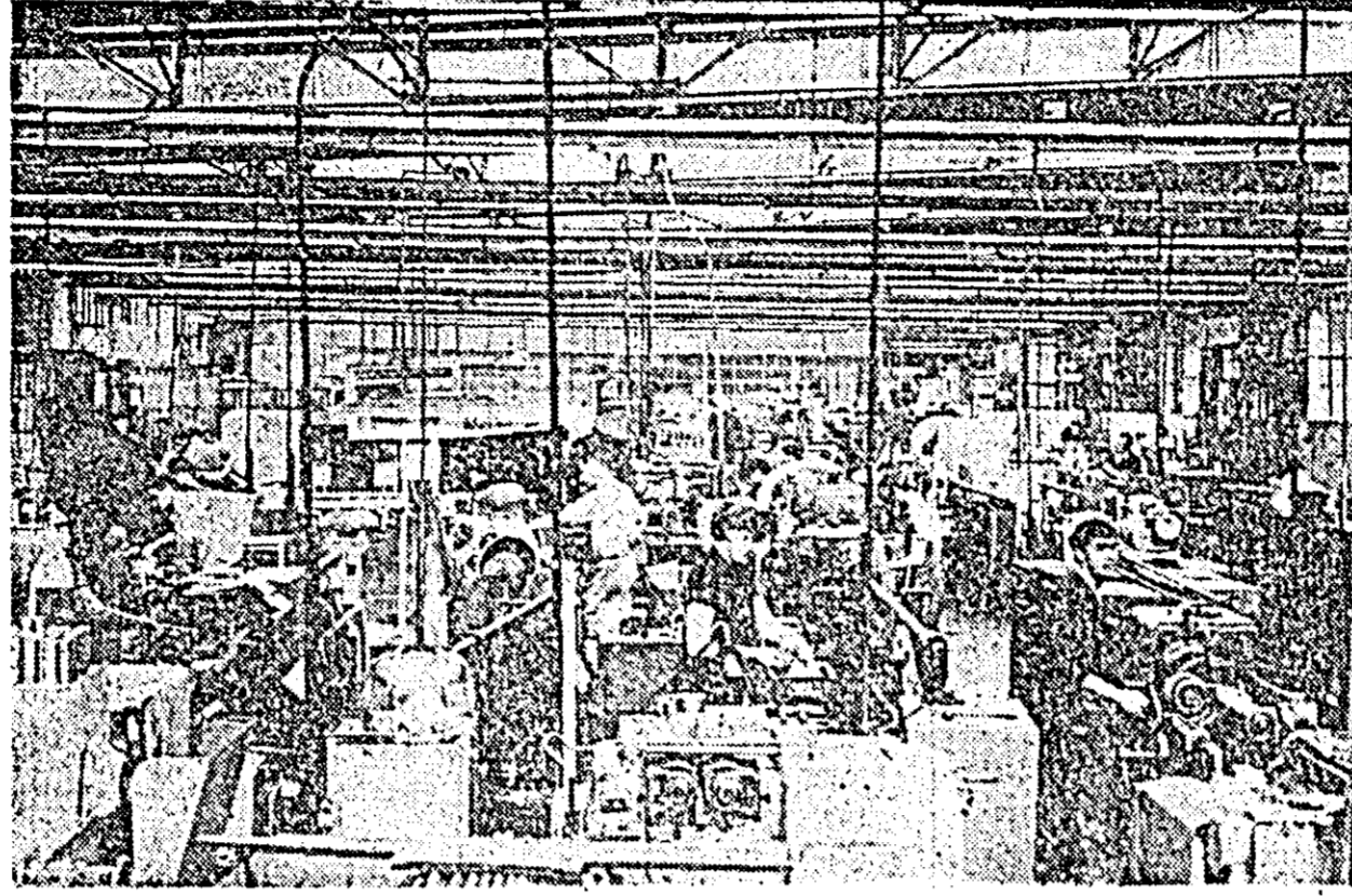
În secția mecanică a Uzinei de strunguri.