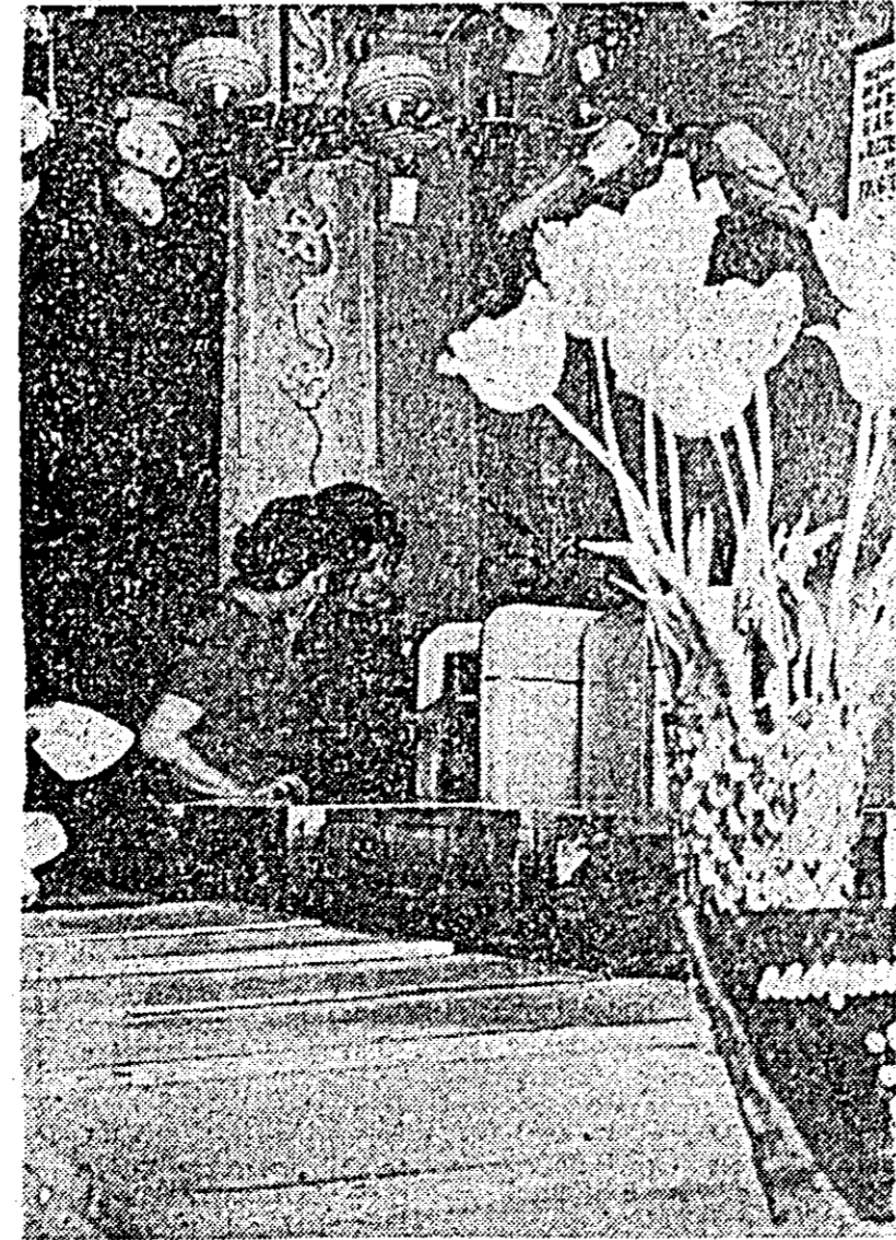
Magazinul „Electro-casnică” e solicitat în fiecare zi de către un mare număr de cumpărători. De la frigider și lustră pînă la cablu pentru televizor sau prize de perete — de toate se găsește la această unitate a O.C.L. „Produce industriale”.

Programul Casei prieteniei ne prilejuește azi după-amiază, la orele 18, audierea unei interesante expuneri cu tema „Tendințe ale artei contemporane”. Expunerea va fi susținută de către criticul de artă Petru Coimănescu din București.