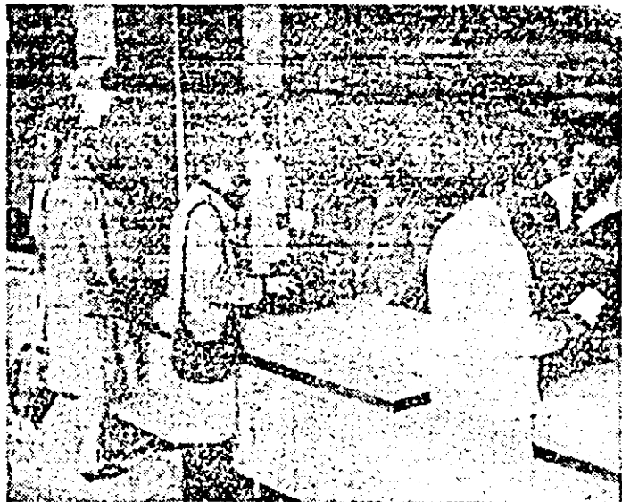
În raionul produse electrice al magazinului „Căminul” cumpărătorii se bucură de o servire atentă, plină de simpatie.