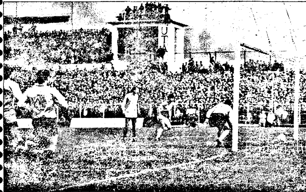
U.T.A. - POLI. TIMIȘOARA 2-3